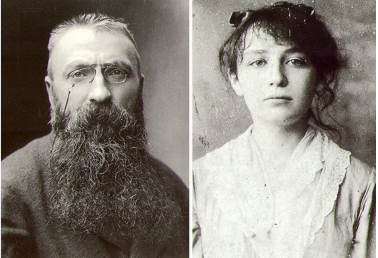
Görsel.3.Camille Claudel 19 yaşında genç bir kızken heykeltıraş Auguste Rodin ise 43 yaşındadır. (Erişim: https://www.iyihisset.com/yasa/rodini-rodin-yapan-kadin-heykeltiras-camille-claudel )

Camille'in heykel yapma isteği babası tarafından maddi ve manevi anlamda tam olarak desteklenmekteydi. Annesi kızının heykel yapmasını istemediği halde aile kızlarının heykel eğitimi alabilmesi için 1881 yılında Paris'e taşınmıştır. Camille 1883 yılında henüz 19 yaşındayken bir grup kadın ile Rodin'in heykel atölyesinde ders almaya başladığında büyük aşkı 43 yaşındaki Auguste Rodin ile tanışır ondan oldukça etkilenir. Rodin oldukça hırslı ama istediği üne henüz kavuşmamış biridir. İşine aşık bu adamın gözü işindeyken çevresine karşı kaba olabilen tavırları bilinmektedir. İşte o sıralar öğrencisi olan Camille'e karşı nazik tavırlı değildir. Rodin işi konusunda ise tutkulu, sabırlı, kararlı dışavurumcudur bu yönleriyle birbirlerine benzerler. Camille'in üstün yeteneği, çalışkanlığı, disiplinli olması ve etkileyici kişiliğini fark eden Rodin ise 20 yıllık evli olmasına rağmen Camille ile yakınlaşmakta sakınca görmemiştir.