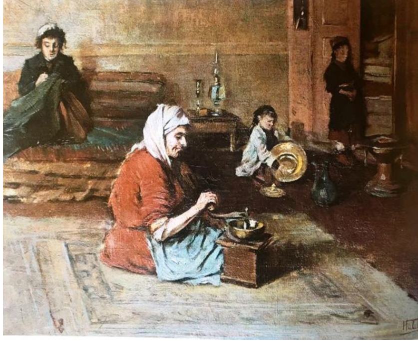
Resim 6: Halil Paşa, Enteriyör , 1899, Tuval üzerine yağlıboya, 70x90 cm, Emir Batuş Koleksiyonu, (Gören 2007, 86)

değişimle birlikte farklı işlevler için kullanılan tek oda kavramı farklı odalara yerini bırakır. Eşyalarda bu değişime ayak uydurur. Yüklük yerine dolap, sedir yerine koltuk, niş yerine aynalı konsol, ocak yerine soba ve kalorifer kullanılmaya başlanır. Böylece geleneksel eşyalar geçmişe ait simgeler olarak hafızalarda yerini alır.