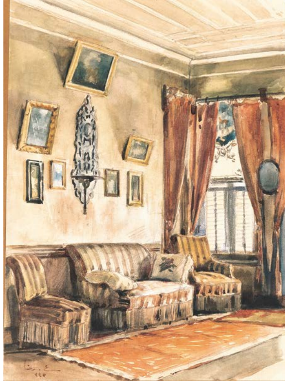
Resim 3: Hoca Ali Rıza, Ev İçi , 1917, Kâğıt üzerine yağlıboya, 29x21 cm, Sabancı Müzesi, (Şerifoğlu (Ed-Haz.) 2018, 259)

Günlüklerinde, makale ve denemelerinde Türk toplumunun sosyal, siyasal, ekonomik birçok meseleleri üzerinde fikir belirten bir düşünür olarak Ahmet Hamdi Tanpınar 19. Asır Türk Edebiyatı Tarihi 'nde devletin Batı'ya kendisini açmasıyla İstanbul'daki değişen hayatın hızına değinir.