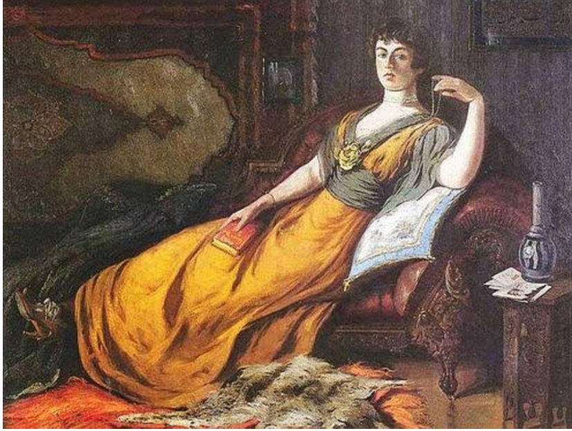
Resim 1: Şehzade Abdülmecid, Harem'de Goethe , 1917, Tuval üzerine yağlıboya, 133 x 174 cm, Ankara Devlet Resim Heykel Müzesi koleksiyonu, (Yaman 2012, 131).

19. yüzyılın ikinci yarısına gelindiğinde yeni kullanım eşyaları artık toplumsal hayatın içerisine yerleşmiştir; ancak eski ve yeninin birlikteliği hâlâ devam eder. Eklektik bir yorumla dekore edilen evler ne tam Batılı'dır ne de tam olarak Doğu'lu. Doğu ve Batı arasındaki ikilik Osmanlı halkının zevkine işaret eden birer gösterge haline gelir. Servet-i Fünûn romanlarında Batı kaynaklı eşya evin her yerine yayılır. Söz konusu romanların yazarları da benzer bir çevre içindedirler ve konu olarak aldıkları kişilerin bu dünyanın içinden ya da heveslenen kişiler olması, romanların mekânını ve eşyanın niteliğini belirler.