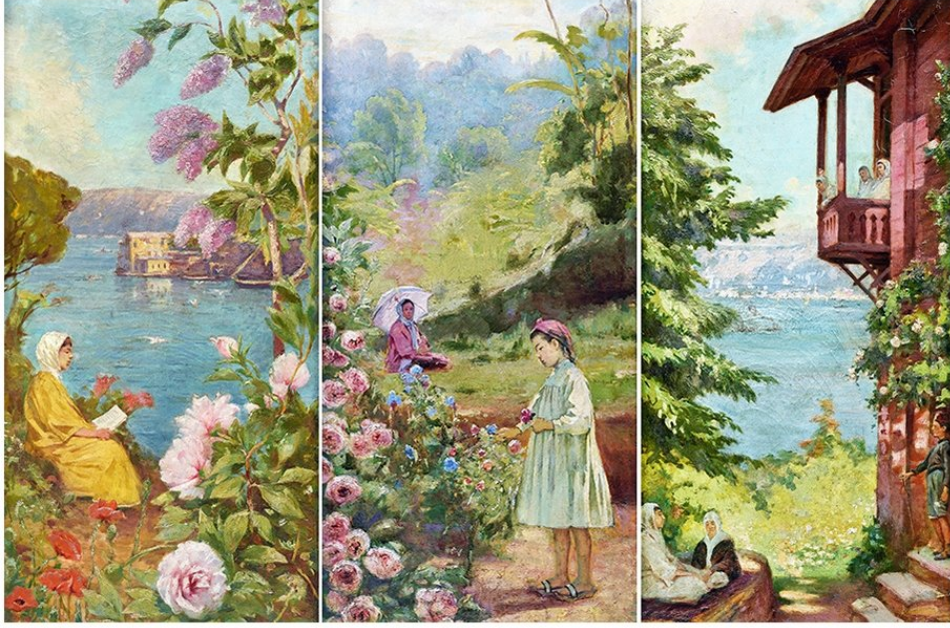
Resim 7: Halil Paşa (1852-1939) İstanbul Üçlemesi , 1915, Tuval üzerine yağlıboya, 120x100 cm, Provenance: Eski Birkökler Vakfı Koleksiyonu, (URL 1 https://www.artamonline.com/298-muzayede-degerli-tablolar-ve-antikalar/18151-halil-pasa-1852-1939-istanbul-uclemesi ) (Erişim Tarihi 10.07.2019)

Millî edebiyat devrinin önde gelen isimlerinden Yakup Kadri Karaosmanoğlu'nun, Kiralık Konak 29 eserinde Sultan II. Abdülhamid Devri'nin önde gelen isimlerinden Naim Efendi'nin Cihangir'deki konağı anlatılır. Bu konak, çökmekte olan Osmanlı İmparatorluğu'nu sembolize etmesiyle neredeyse romanın en önemli karakteridir. 30 Yakup Kadri Karaosmanoğlu Kiralık Konak 'ta Naim Efendi'nin zamanın getirdiği değişime ayak uyduramamasını geçmişe bağlı kalmasına bağlar. Romanda Naim Efendi'nin karısı Nefise Hanım'ın ölümünden sonra idare kızına geçer. Evde ilk iş eski eşyalar tavan arasına kaldırılır, odalar Avrupa'dan gelmiş mobilya kataloglarına göre ayrı ayrı üsluplarda ve renklerde döşenir, eski emektarlar atılır yerlerine Beyoğlu'ndan gelen beyaz önlüklü hizmetçiler alınır. 31 Yakup Kadri, Naim Efendi'nin karşısına damadı Duyûn-ı Umumiye müfettişi olan Servet Bey'i koyar. Servet Bey'in Batıya olan hayranlığı o derece ileridir ki Meşrutiyet ilan edildiğinde evde Türkçe konuşulmasını yasaklar. Yazarın konak üzerinden evin içindeki değişim ile bireyde görülen değişimi gösteren ve bir dönemin kapanmasını anlattığı bu roman, Türkçenin yasaklanması gibi önemli bir olayı Batılılaşma hayranlığıyla köklerinden uzaklaşma örneği olarak vurgular. Başkalaşan bir insanın eviyle beraber dilinin de değişmeye başlamasının olumsuz bir örneğini temsil eder. 32