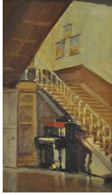
Resim 4: Hoca Ali Rıza, Kendi Evinden Bir Köşe , 24x16 cm, Kağıt üzerine suluboya, Ankara Milli Kütüphane, (Şerifoğlu (Ed-Haz.) 2018, 169)