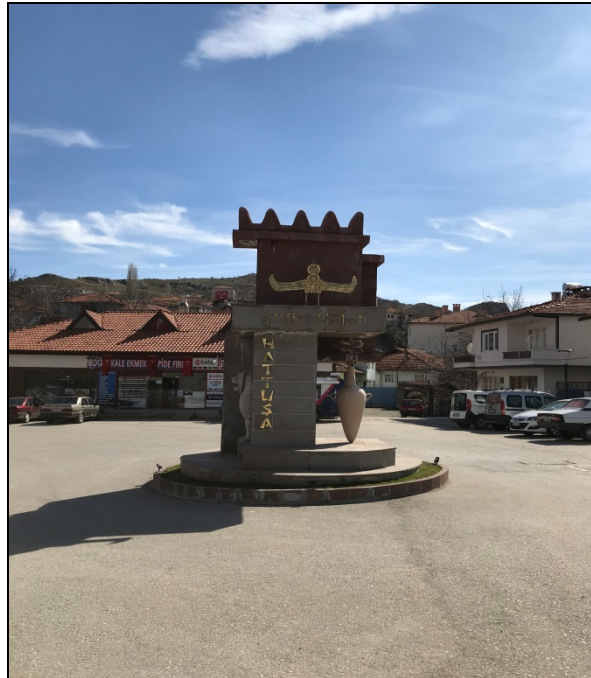
Şekil 5: Boğazkale ilçesinin meydanından bir görünüm

Osmanlı döneminde ise 16. yy'da Dulkadiroğulları'nın Maraş civarındaki etkilerini kırmak amacıyla belli bir grubu Boğazkale'ye sürgün olarak gönderilir. Bu dönemlerde şehre ve civarına yerleşen Dulkadiroğulları kendi isimleri ile anılan konaklar yapmışlardır (Şekil 7 b). Yakın zamanda Çorum'un Sungurlu ilçesine bağlı bir kasaba olan Boğazkale 1987 yılında ilçe haline getirilmiştir (Şekil 5). 23