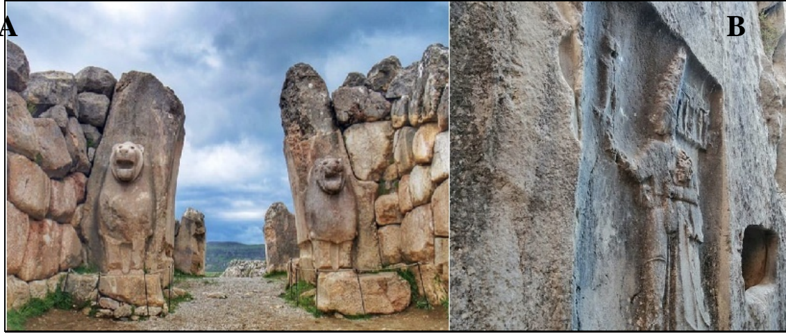
Şekil 6: Hititler dönemine ait Aslanlı yol (A) ve Yazılıkaya (B)