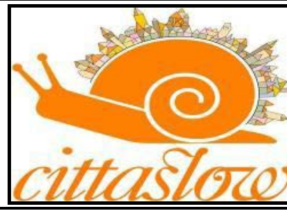
Şekil 2. Cittaslow Logosu (Cittaslow, Türkiye)

Felsefesi Slow Food hareketine indirgenen yavaş şehir hareketi ise 1999 yılında Greve in Chianti'nin eski belediye başkanı Paolu Saturnini'nin vizyonu doğrultusunda ortaya çıkmıştır. Bu hareket kısa sürede İtalya'da birçok şehre sıçramıştır ve çok sayıda destekçi bulmuşlardır. Slow Food başkanı Carlo Petrini'de en büyük destekçilerinden birisi olmuştur. 7 2009 yılında İzmir'e bağlı Seferihisar İlçesi bu harekete üye olmuştur ve ülkemiz de bu ağa böylelikle katılmıştır (Şekil 2). Yavaş şehir hareketinin koyduğu kriterler sayesinde üye ve üye olmak isteyen kentlere sürdürülebilir çevre ve kalkınma anlayışına sahip, yaşam kalitesini yükselten bir kente ulaşmayı hedeflemek için sorumluluklar yüklemektedir. 8 Yavaş yemek hareketinin şehirlerdeki yaşam şekli olarak da nitelendirebileceğimiz yavaş şehir ile birlikte bu ikisine yavaş hareketi denilmektedir. 9