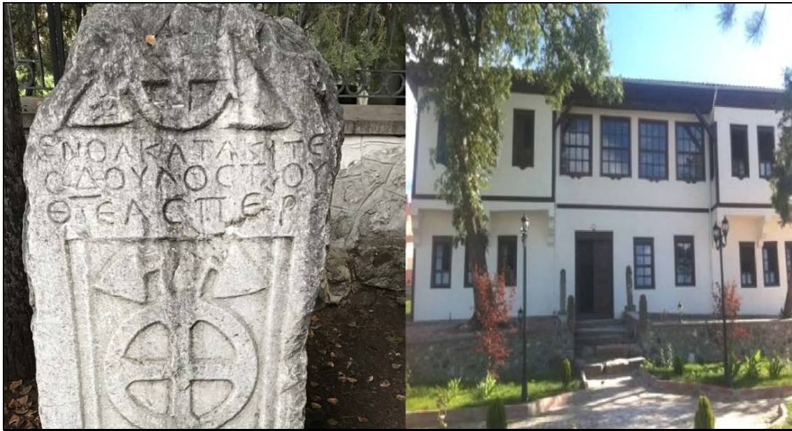
Şekil 7: Bizans dönemine ait bir taş (A) ve Dulkadiroğulları dönemi konaklarını yansıtan bir yapı (B)

Bölgenin en önemli gelirini tarım oluşturmaktadır. Boğazkale'de kırsal karakter ve kır ekonomisi hakimdir. Kurak yerlerde buğday ekimi yaygınken, sulak alanlarda sebze üretimi ön plandadır. Yörede eskiden beri var olan üzüm bağları da dikkat çekmektedir. Bunların yanında bölgede yetişen ve on dilim olarak bilinen kavunda yetiştirilmektedir. Hayvancılıkta önemli bir gelir kaynağıdır. Hayvancılık faaliyetleri genel olarak mera hayvancılığı şeklindedir. Sulak yerlerde büyükbaş hayvancılık olsa da genelde kurak yerlerde küçükbaş hayvancılık görülmektedir.