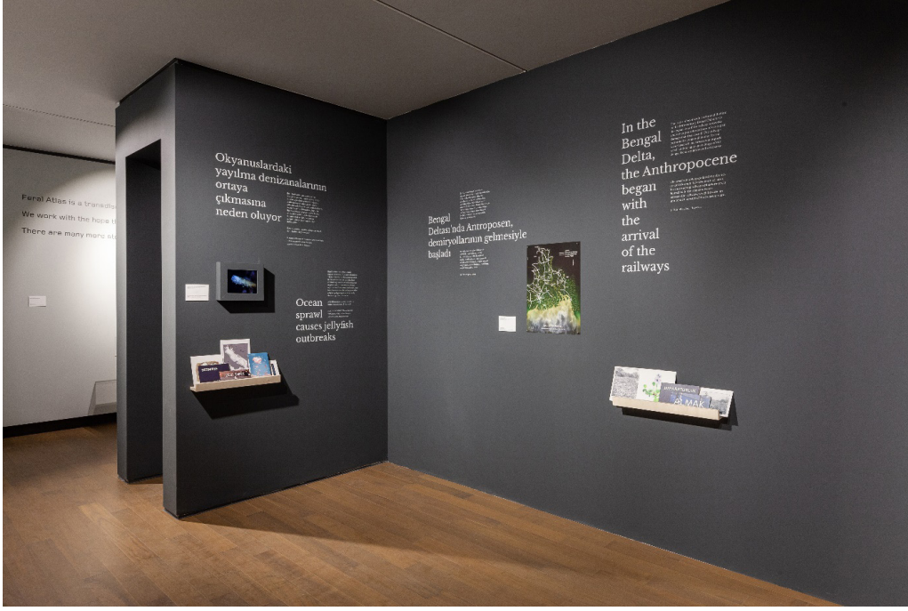
Görsel 3. Feral Atlas Collective, 2019.