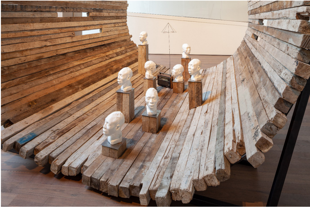
Görsel 4. Radcliffe Bailey, "Nommo", 2019, fotoğraf: Sahir Uğur Eren.