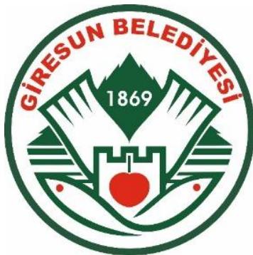
Şekil 6. Giresun belediyesinin logosu

Giresun, Ankara-Trabzon karayolu üzerinde ormanlarla kaplı yaylaların ve doğal plajların bulunduğu, 122'km lik kıyıya sahip, doğal ve kültürel zenginlikleri olan önemli bir turizm merkezidir. Giresun Adası (Aretias) başlı başına bir turizm potansiyelidir. Giresun ilinin