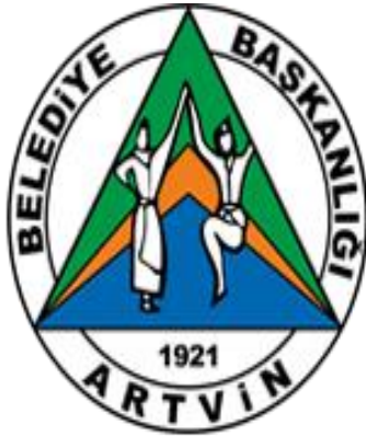
Şekil 1. Artvin belediyesinin logosu

Türkiye'nin Karadeniz Bölgesinde, Doğu Karadeniz Dağları üzerinde yer alan Artvin ilinin hem Gürcistan'a hem de Karadeniz'e sınırı vardır. Artvin ili engebeli bir araziye sahiptir ve %55 ormanlık alanı vardır. Logonun içerisinde de bu özellikler öne çıkartılmıştır. Şekil 1' de görülmekte olan Artvin Belediye Logosu incelendiğinde daire şeklinde bir geometrik form ve içinde büyük bir üçgen görülmektedir. Şehrin engebeli bir araziye sahip oluşu iç içe geçen üçgenlerin art arda sıralı yerleştirilmesi ile vurgulanırken renkler de yine ilin özelliklerini yansıtır niteliktedir. Üçgen formların ilkinde Artvin ilinin denize sınırının oluşu ve şehirden geçen birçok akarsu ve dere nedeniyle mavi renk kullanılmıştır. Mavi renk huzur veren, sakinleştiren, dinlendiren bir renk olmakla birlikte istikrar mesajını arttırmak için birçok kurum tarafından amblem ve logolarda kullanılır (Elliot, 2019; Elliot ve Markus, 2014). Bir sonraki üçgen formunda ise yine şehrin önemli maden kaynaklarından olan bakır madenlerini simgeleyen turuncu renk kullanılarak bakıra dikkat çekilmiştir. Üçüncü ve arka planda daha büyük yerleştirilen üçgende ise şehrin ormanları ve doğasını anlatan yeşil renk kullanılmıştır. Yeşil renk aynı zamanda sağlığın ve çevrenin rengidir. Yine logonun içerisinde kullanılan siyah