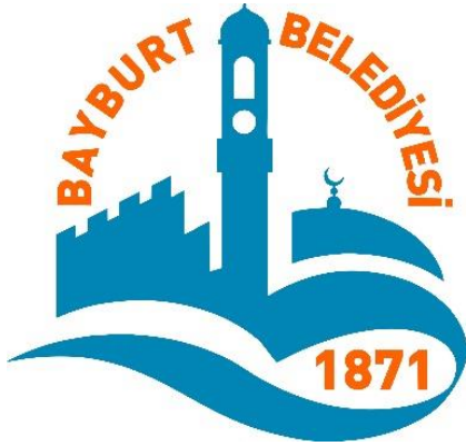
Şekil 4. Bayburt belediyesinin logosu

Bayburt Doğu Anadolu'yu Karadeniz'e bağlayan Erzurum-Trabzon tarihi İpek Yolu üzerindedir. Marco Polo ve Türk seyyah Evliya Çelebi bu yoldan geçmişlerdir. Çoruh nehrinin kıyısında bulunan şehrin tarihi M.Ö. 3000'lere kadar uzanan küçük bir şehirdir (Çoruhlu, 2000).