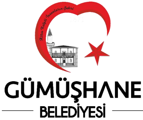
Şekil 5. Gümüşhane belediyesinin logosu

Doğu Karadeniz Bölgesi'nde bulunan Gümüşhane ili kuzeyde Trabzon, doğuda Bayburt, güneyde Erzincan, batıda Giresun illeri ile çevrelenmektedir. Erzurum ile Trabzon yolunun bulunduğu Harşit vadisi üzerindeki kurulmuş küçük bir şehirdir.