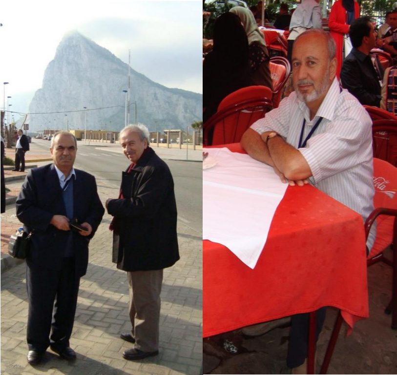
İspanya-Cebel-i Târik (8 Aralık 2011)