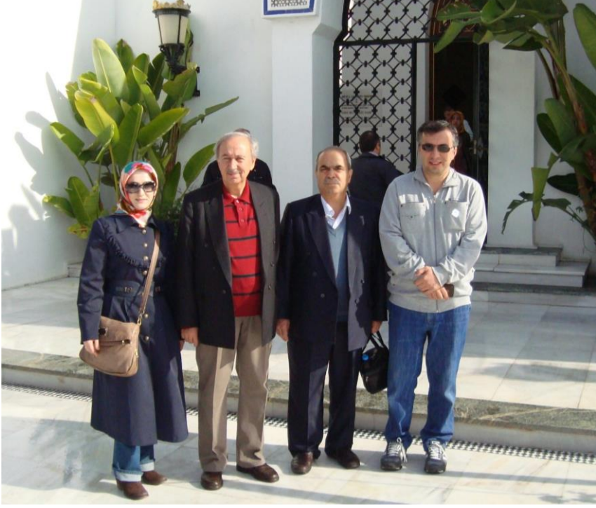
İspanya-Marbella, Kral Abdülaziz Camii (8 Aralık 2011)