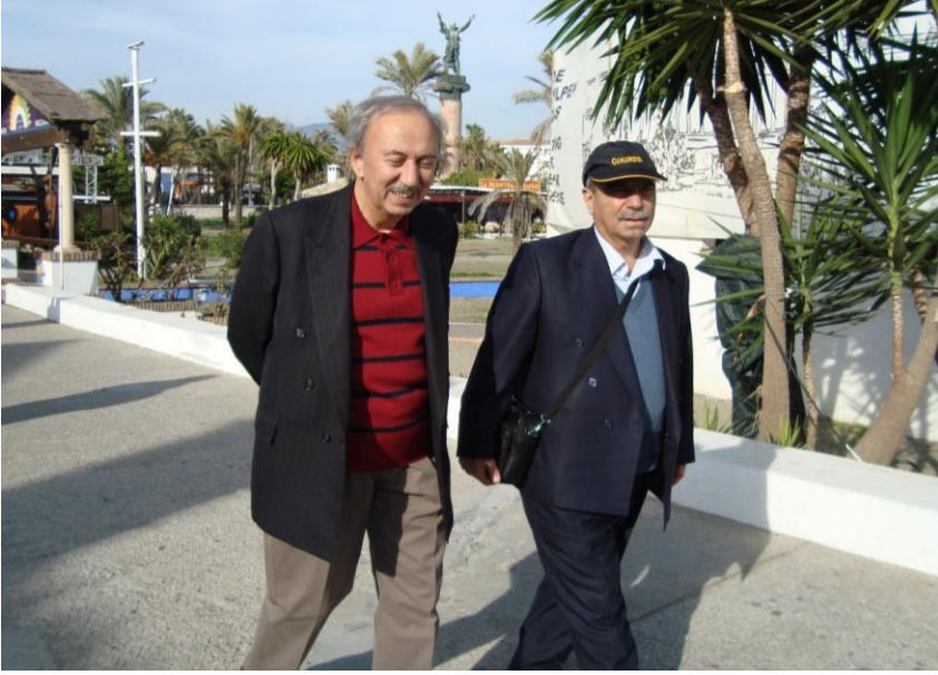
İspanya-Marbella, Puerto Banus (8 Aralık 2011)