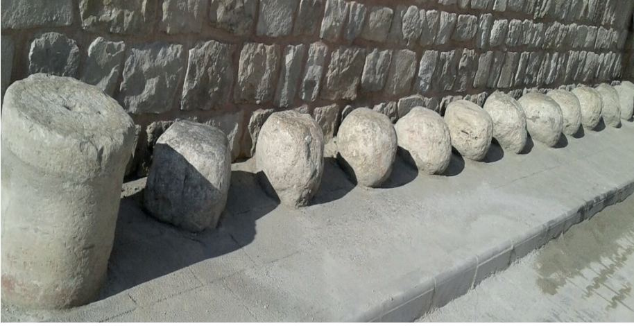
Görsel 12: Sol baştaki binek taşı ( Diğer on bir taş misafir taşıdır).

Misafir taşı sahibi aileler günün her vaktinde ev ahalisinden birisini veya çocuklarını camiye yollayarak taşlarında oturan misafirlerinin olup olmadığını kontrol ederlermiş. Vakit namazlarından sonra aile büyüklerinin de aynı şekilde taşlarında oturmuş bir misafirlerinin olabileceği düşüncesiyle top taşları kontrol ettikleri bilinmektedir. Türk misafirperverliğinin en güzel örneği olan bu top taşlar günümüzde fazla kullanılmamakla birlikte misafirlik geleneğinin güzel örnekleri olarak varlıklarını devam ettirmektedirler.