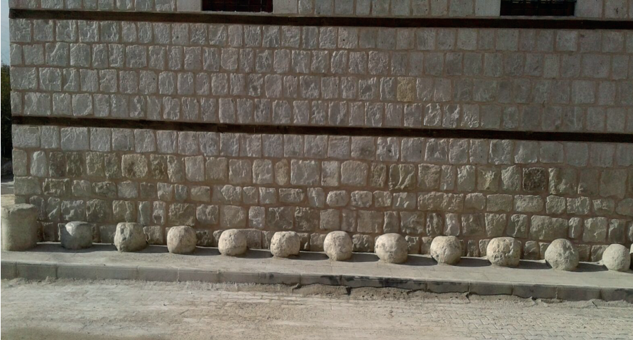
Görsel 13: Toptaş Camii'nin sol saçağı ve oval misafir taşları.

Misafir taşı sahibi aileler günün her vaktinde ev ahalisinden birisini veya çocuklarını camiye yollayarak taşlarında oturan misafirlerinin olup olmadığını kontrol ederlermiş. Vakit namazlarından sonra aile büyüklerinin de aynı şekilde taşlarında oturmuş bir misafirlerinin olabileceği düşüncesiyle top taşları kontrol ettikleri bilinmektedir. Türk misafirperverliğinin en güzel örneği olan bu top taşlar günümüzde fazla kullanılmamakla birlikte misafirlik geleneğinin güzel örnekleri olarak varlıklarını devam ettirmektedirler.