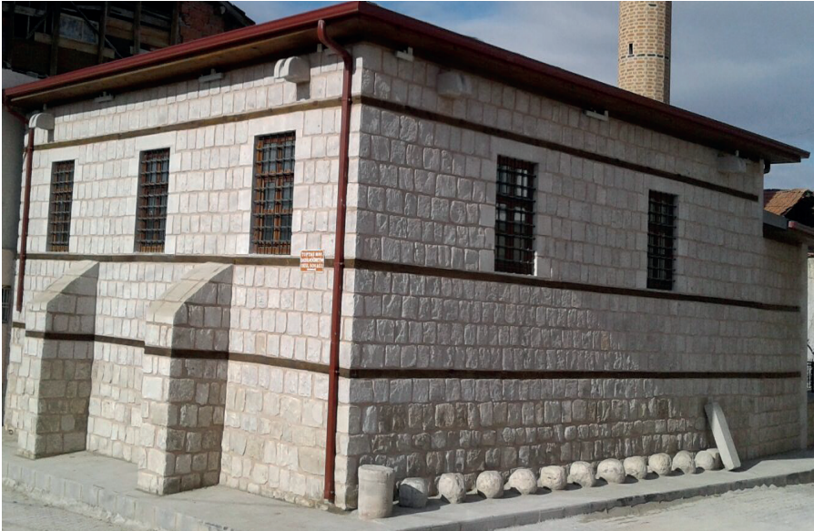
Görsel 11: Toptaş Camii'nin sol cephesinde yer alan misafir taşları.

Yolcunun, yoksulun, ihtiyaç sahibinin veyahut diğer başka sebeplerle bir yerde dinlenmesi gereken kimselerin Tanrı misafiri olduğu kabul edilip ağırlanması gerekir. Türklerde bu gelenek geçmişten günümüze kadar varlığını devam ettirmiştir. Türk kültürü ve adetleri hakkında ayrıntılı bilgilere yer veren Divanu Lügati't-Türk'te misafirle ilgili şu bilgilere yer verilir: “ Konuğa, komşuya ve akrabalarına iyilik et, onları ağırla, armağan alıp güzel uğurlu mallar hazırla ” (Kaşgarlı Mahmut, 1992: 114). Nitekim misafirin kutsiyetinin farkında olan bu insanlar mimari yapılarında da bu hassasiyeti gözetmişlerdir. Türkler