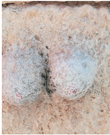
Görsel 15: Genç ailesine ait eski taş evin sağ cephesinde yer alan göğüs / misafir taşı.