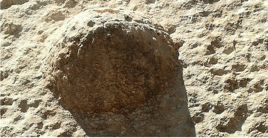
Görsel 16: Selâmlı köyünde başka bir evin duvarında bulunan tek göğüs/misafir taşı.

Arapgir'in Selâmlı köyünde yer alan biri çift, biri tek göğüs/anne taşları misafirlik geleneğinin mimari bir göstergesidir. Bu taşlar, genelde Türk milleti özelde ise Anadolu ve Malatya insanının ne kadar yardımsever ve ne kadar paylaşımcı olduğunu göstermenin yanı sıra toplumda sosyal dayanışmanın ne kadar kuvvetli olduğunu da göstermektedir. Hem Battalgazi'de hem de Arapgir Selâmlı'da yer alan misafir taşları Malatya yöresinde yoksul ve ihtiyaç sahiplerine gösterilen hassasiyetin izlerini taşımaktadır.