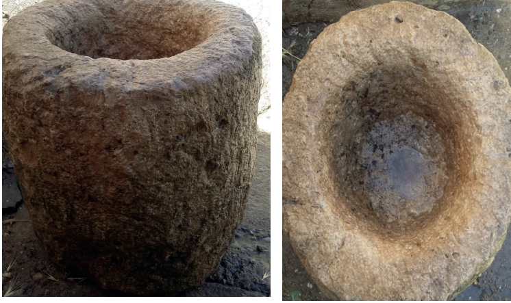
Görsel 1: Dibek taşının dıştan ve içten görünümü.

Buğdayın daha kolay kabuğundan ayrılması için yıkanıp kurutulduktan sonra tokmakla dövüldüğü oyuk taşa dibek taşı denilir. “ Dibek taşı ” Anadolu’nun pek çok yerinde yaygın olarak kullanılagelmiştir. Dibek taşının evlerin dışında genellikle harman yerleri, pınar kenarları ve mahalle boşluklarında yer aldığı görülmektedir (Acun, 2010: 6).