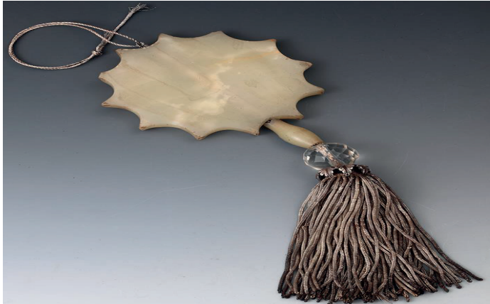
Görsel 7: Teslim taşı.

3- En altındaki düğüm katledilen Nesimî'yi simgeler.