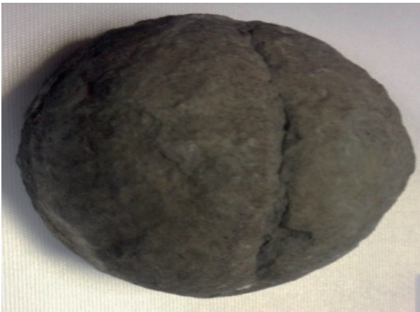
Görsel 4: Ayşe-Fatma taşı.

Bereket amacıyla kullanılan bir başka taş da “ Ayşe-Fatma taşı ”dır. Bu taşın da bereket taşı gibi tahıl ambarlarında, un haznelerinde, evlerin erzak odalarında saklanıp muhafaza edildiği görülmektedir. Fatma Ana taşı olarak da bilinen bu taş, nesli tükenmiş olan bir deniz hayvanının fosilidir. Uğur böceğine benzediği için bereketin sembolü olarak pek çok yerde kullanılan Ayşe-Fatma taşı genellikle avuç içi kadar büyüklüğe sahiptir ve Hekimhan yöresinde irili ufaklı bolca örneği görülmektedir.