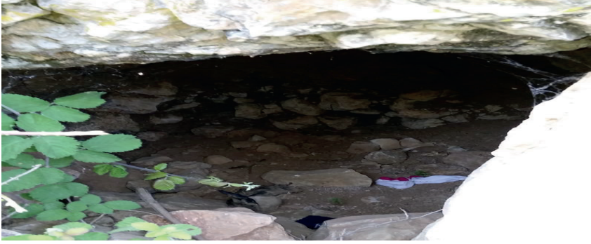
Görsel 6: Şifa taşının içerisine bırakılmış atlet ve yazma gibi hasta eşyaları.

kadar yansıtılmıştır. Teslim taşı, Bektaşî dergâhına teslimiyet manasına gelip, dervişlerin boyunlarından çıkarmadıkları taştır. Teslim taşının iç yüzü -yani batîni- Hz. Ali'yi, dışa bakan yüzü ise -zahiri - yani Hz. Muhammed'i temsil eder. Teslim taşı Bektaşî dervişlerinin taşıdığı bir manadır; Bektaşîler, teslim taşını yüzünü Allah'a dönmüşlerin taşı olarak tarif ederler.