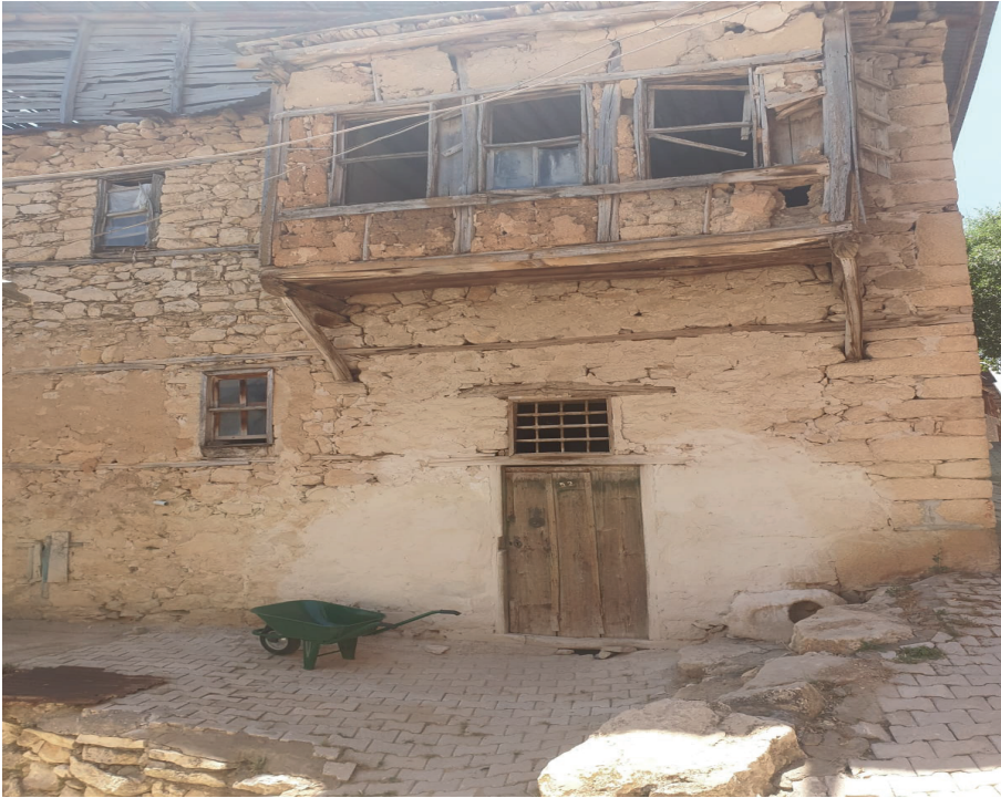
Görsel 14: Arapgir Selâmlı'daki Genç ailesi konağının ön cephesi.

Yine Türk kültüründe "Umay Ana" inancı çerçevesinde kadın ve anne kavramlarını düşünerek Selâmlı köyündeki misafir taşlarını değerlendirmek