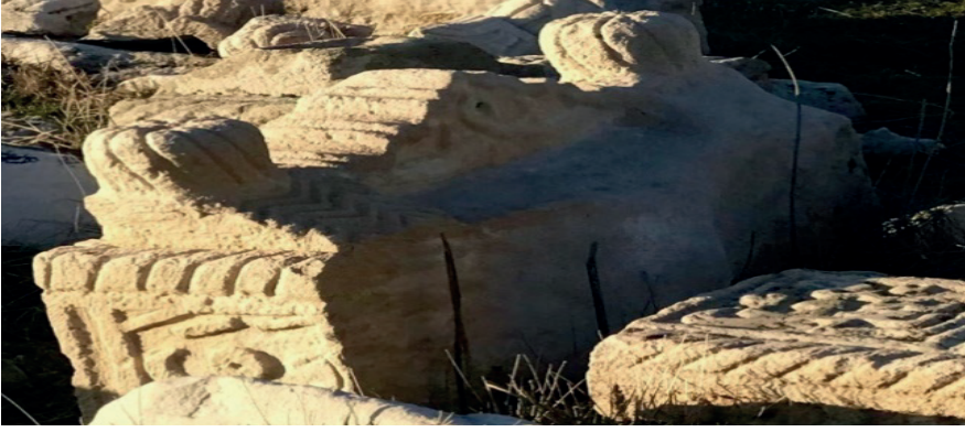
Görsel 8: Malatya Battalgazi Kırk Kardeşler Mezarlığı'nda yer alan beşik taşı.

Beşik taşı , Malatya'nın Battalgazi ilçesinde Kırk Kardeşler Mezarlığı içinde bulunmakta ve şekil yönüyle de bir beşiğe benzemektedir. Bu tarihî taşa karşı, çocuğu olmayan anne adayları belli ritüellerle dua ederler. Bu taşın adını; anne adaylarının taşı beşik gibi sallamasından almış olduğu görüşü yaygındır. Beşik taşını sallayarak dua edip etrafını üç defa döndükten sonra çocuğu olmayan kadınların anne olacağına dair yaygın bir inancın olması bu taşın kutsiyet görmesine yol açmıştır