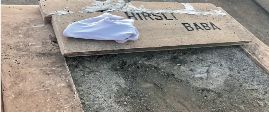
Görsel 9: Hırslı Baba/ Hırs taşı Malatya/Battalgazi.