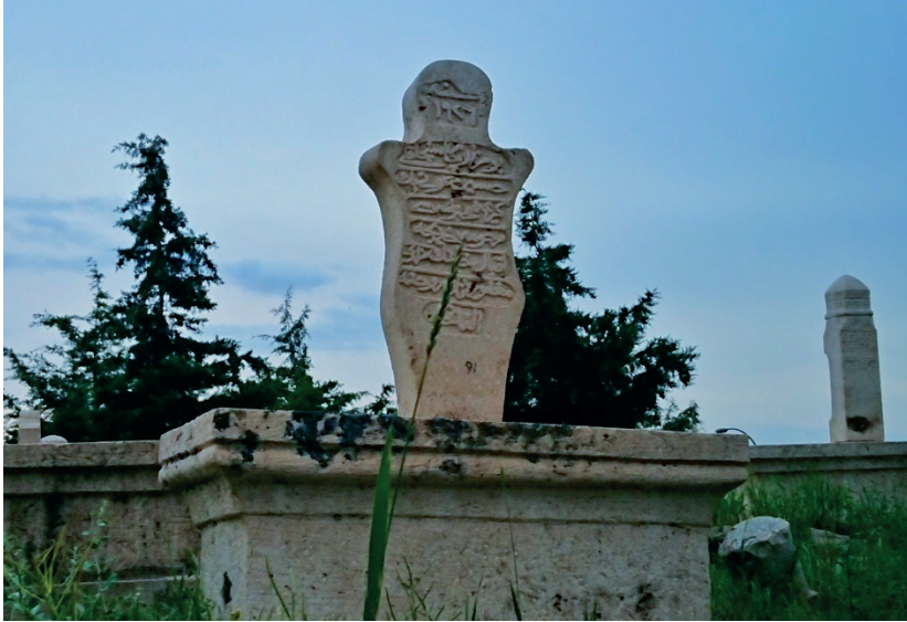
Görsel 3: Sancaktar Mezarlığı’nda yer alan tarihî mezar taşları.

İslamiyet’ten önce “bengü taşları” ve “balbal” adı verilen mezar taşları İslamiyet’ten sonra ise vefat eden kimsenin adının ya da soyunun yazıldığı anıt taşlar olarak görülmektedir. Bu taşlara en güzel örnek, her biri birer sanat harikası olan ve taş işçiliğinin de başarılı örneği sayılabileceğimiz, Malatya merkezinde bulunan Sancaktar mezarlığına ait mezar taşlarıdır.