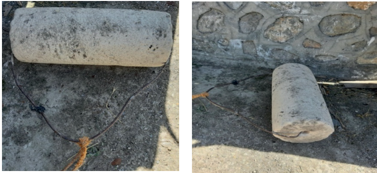
Görsel 2: Loğ taşları.

Anadolu’da toprak evlerin damını sertleştirmek için kullanılan yuvarlak geniş taşlardır. Bu taşlar kar, yağmur sonrasında damların sertleştirilip toprağının sıkıştırılarak damın su akıtmasını engellemek için