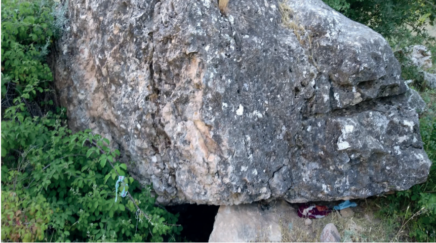
Görsel 5: Şifa taşının dış görünüşü.

Malatya ve çevresinde yaygın olarak hasta olan kimselerin iç çamaşırlarından veyahut kıyafetlerinden bir parçanın Yunus balığı şeklindeki bu şifa taşının altına konulması hâlinde insanların hastalıklarının geçeceğine ve şifa bulacağına inanılmaktadır. Malatya'nın Venk köyünde bir akarsu yanında bulunan taş buna en güzel örnektir. Venk ahalisi, bu taşın altından geçen kadınların çocuk sahibi olacaklarına da inanmaktadır.