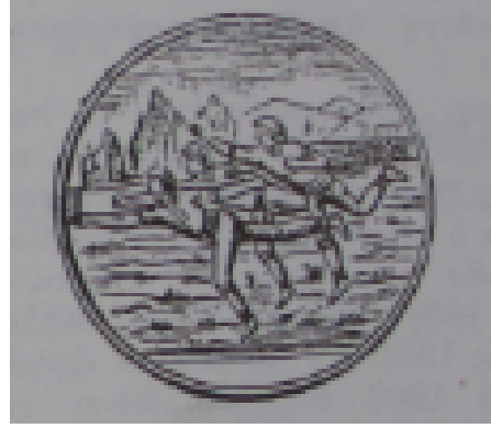
Resim II. Apollon Smirnis'in ilk amblemi

1910'lardan sonra Mütareke dönemine kadar (1918-1922) İzmir'deki futbol kulüplerinin İzmir Limanına gelen yabancı gemi mürettebatlarıyla maçlar yapması neredeyse bir gelenek haline gelmiştir. İzmir'deki tüm futbol takımlarıyla maçlar yapan Apollon Smirnis, aynı zamanda İzmir Limanına gelen yabancı gemi mürettebatlarıyla da maçlar yapmıştır. 1911 yılında Avusturya Savaş Gemisi "Wirintus"un ekibiyle yaptığı maçta önemli bir galibiyet kazanmıştır. Takımın önemli bir diğer galibiyeti de 1918 yılında gerçekleşmiştir. Osmanlı Devleti'nin Birinci Dünya Savaşı'ndan yenik çıkması sebebiyle İzmir Limanına demirleyen ilk İngiliz Savaş Gemisi "Minitor 19" bu esnada Apollon Smirnis ile maç yapmayı ihmal etmemiştir. Bu müsabaka Apollon'un galibiyetiyle sonuçlanmıştır. 28