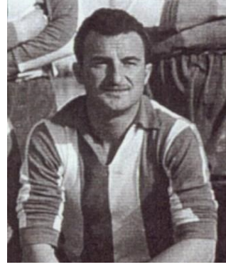
Resim IV. Georgios Kamaras Kaynak:

Buna verilebilecek en güzel örnek Apollon’un 90’lı yılların sonunda güç kaybederek küme düşmesinin ardından, 2013 yılında Süper Lig’e yükselmesidir. Gazette adlı Yunan spor gazetesi 16 Ağustos 2013’te Apollon Smirnis ile ilgili şu manşeti atmıştır: “ 13 Yıl Sonra, “Hafif Süvari”... “Apollon Atina olarak gitti, on üç yıl sonra Apollon Smirnis olarak geri döndü... Mübadil ruhu aynı şekilde muhafaza ediliyor.” 56