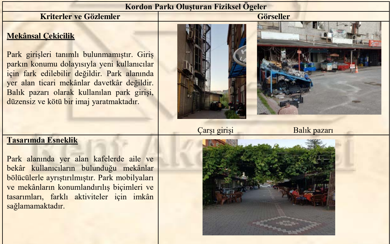
Tablo 1. Kordon Parkı Oluşturan Fiziksel Öğeler

Park kullanıcıları ile yapılan ön görüşmelerde parkın temel sorununun kimlik ve imaj olduğu anlaşılmıştır. Bu durumun ana nedeni kullanıcıların, parkın güvenliği ile ilgili olumsuz görüşleridir. Parkta yapılabilecek aktivitelerin sınırlı olması ve mevcutta kullanımda olan çay bahçelerinin (aile ve bekâr kullanıcılar için) seperatörler ile ayrılmasının sosyalleşme imkânının önüne geçmesi gibi problemlerin varlığı dikkat çekmektedir. Yapılan gözlemlerde, parkta yetişkinler için dinlenme, yeme-içme; çocuklar için ayrılan bölümde oyun oynama dışında yapılabilecek bir aktivite bulunmadığı tespit edilmiştir. Bunun yanında parkın bakım ve temizlik ile ilgili de iyileştirilmesi beklenen sorunlarının olduğu tespit edilmiştir.