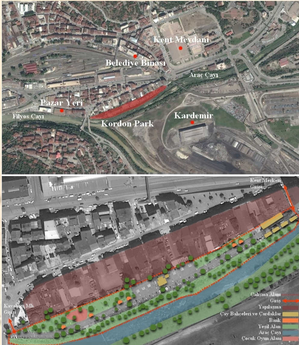
Şekil 1. Kordon Parkın şehir merkezindeki konumu (üstte), parkta yer alan elemanlar ve parkın çevresi ile ilişkisi (altta)

Çalışma alanı olarak Karabük kent merkezinde yer alan Kordon Park seçilmiştir. Park, kentte büyük öneme sahip olan KARDEMİR (Kardemir demir çelik fabrikası) ile çarşı alanı arasında, Araç çayı aksına paralel bir konumda yer almaktadır. Kamusal açık alan eksikliği bulunan Karabük kent merkezinde, bulunduğu konum ve vermeyi amaçladığı hizmet ile bir ihtiyacı karşılamaktadır. Konum itibarıyla alternatifinin olmayışı, çevresindeki yeşil elamanlar ve su aksı ile bir potansiyele sahip olması nedeniyle kent kullanıcıları için önemlidir. Bu bağlamda, seçilen alanın kalite standartlarının değerlendirilerek kullanıcı memnuniyetinin ölçülmesinin önemli olduğu düşünülmüştür. Çalışma doğrultusunda çıkan sonuçların, ileride gerçekleştirilecek çalışmalarda parkın potansiyelini artırıcı katkısı olacağı düşünülmektedir.