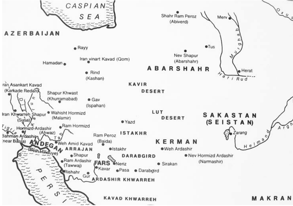
Fig. 3. Sasaniler Dönemi'nde Apar Ülkesi

(Apar) şeklinde de görülen yazım şekli, 55 Abbasi Halifesi Me'mûn Dönemi'ne, yani 825 tarihlerine kadar erken dönem Emevi ve Abbasi sikkelerinde "Abarşahr" olarak görülebiliyorsa da 56 772 tarihlerinden beri artık İslâm sikkelerinde "Nişapur" (< Niv-Şâpûr 'Şapur'un İyi Şeyi') kelimesine de