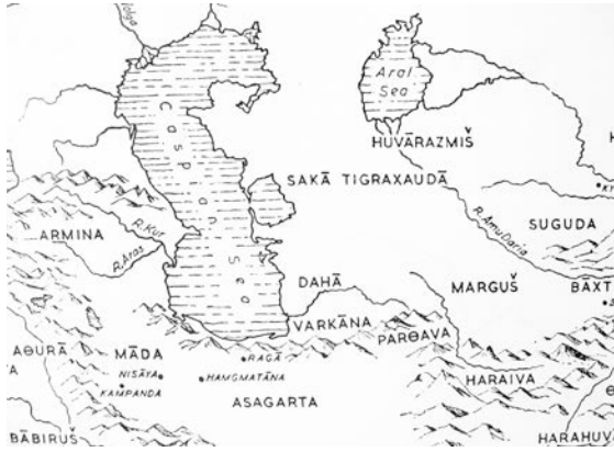
Fig. 1. Ahamenid İmparatorluğu Döneminde Sakaların ve Dahae'lerin Ülkeleri

Aparni'lerin dâhil bulunduğu Dahae'ler, tarihçi Herodotos'ta (I. 125), Ahamenidlerin göçebe kabilelerinden biri olarak " Daai " (Δαί) şeklinde, Avesta 'da (Yasht 13. 143) ise " Daha " olarak geçmektedir 2 . Herodotos, Ahamenid İmparatorluğu'nu oluşturan satraplıkların bir listesini veriyor (III. 90-94); ama bu liste, Dareios'un meşhur Behistun kitabesinde verilen listeden oldukça farklıdır ve aynı durum Sakalar için de geçerlidir 3 (Fig. 1). Ahamenid hükümdarı Dareios (M.Ö. 522-486)'un Behistun kaya kitabesindeki ilk daeva/dahyavâ/dahyu (= eyalet/ülke 4 ) listesinde bütün Sakalar tek bir grup olarak verilmiş gözüküyor. Daha sonraki Listede ise bilinen iki Saka grubu ( Saka Haumavargâ (= Haoma içen Sakalar) ve Saka Tigraxaudâ = Sivri başlıklı Sakalar), 5 daha sonra üçüncüsü ( Saka tayaiy paradraya = Deniz-Ötesi Sakaları) zikredilmiştir 6 . I. Kserkses'in (M.Ö. 486-465), İmparatorluğu meydana getiren 30 eyaletin bir listesinin verildiği " Daeva Kitabesi "nde ise "Dahae" ismi, listenin sonuna doğru, Sakaların açıkça bildiğimiz iki boyu ( Saka Haumavargâ ve Saka Tigraxaudâ ) ile birlikte " Dahâ " şeklinde ve ilk defa kaydedilmektedir 7 .