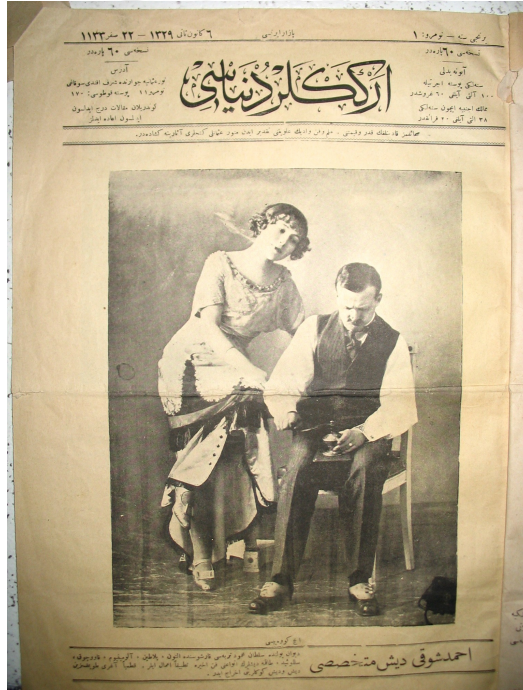
Erkekler Dünyası (19 Ocak 1913): Kapak