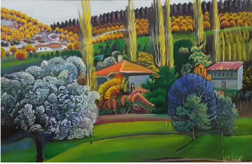
Resim 4: Çamlıca'dan, 1998, T.Ü.Y.B, 50 X 70 cm

Kaynak: (Nafi Güral Koleksiyonları Müzesi, Özel Hüseyin Yüce Koleksiyonu, Kütahya).