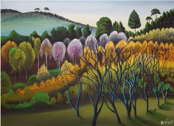
Resim 1: Hüseyin Yüce, Köyümden, 40x55cm, T.ü.y.b, 1996

Kaynak: (Nafi Güral Koleksiyonları Müzesi, Özel Hüseyin Yüce Koleksiyonu, Kütahya).