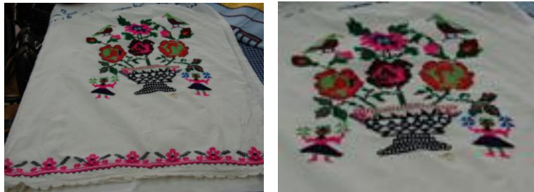
Görsel 5. Elbise örtüsü 5 (Akpınarlı v.d., 2012, s. 255)

Örnek 4'teki elbise örtüsünde; beyaz zemin üzerinde bitkisel bezemelerden çiçek, dal, yaprak, tomurcuk motiflerinin, geometrik bezemelerden üçgen ve düz çizgi motiflerinin hakim olduğu görülmektedir. Kompozisyon açısından değerlendirildiğinde; yüzeyde tam rapor düzeni kullanılmaktadır. Kumaşın alt kısmında iki düz çizgi arasında üçgen motifleri bordür şeklinde, bordürün üzerindeki çiçek, dal, yaprak, tomurcuk motifleri ise yüzeyde serbest düzende yer almaktadır. Kumaşın zemininde beyaz renk hakim, motiflerde ise sarı, kırmızı, pembe, siyah, koyu yeşil, açık yeşil, lacivert, turuncu renkler ve işleme tekniklerinden kaneviçe kullanılmıştır.