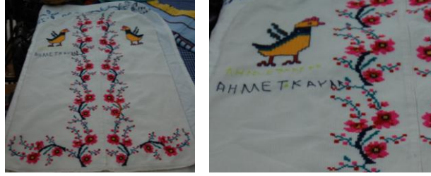
Görsel 6. Elbise örtüsü 6 (Akpınarlı v.d., 2012, s. 256)

yer alırken, bordürün üzerinde çiçek, dal, yaprak motifleri görülmektedir. Kumaşın ortasında vazoda çiçek motifleri, vazo motifinin alt kısmında insan figürleri yer alırken, vazunun üst kısmında ise kuş motifleri yer almaktadır. Kumaşın zemininde beyaz renk hakim, motiflerde ise pembe, siyah, koyu yeşil, açık yeşil, koyu mavi, kahverengi, kırmızı renkler ve işleme tekniklerinden kanaviçe kullanılmıştır.