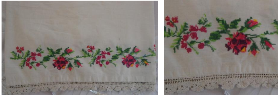
Görsel 10. Elbise örtüsü 10 (Akpınarlı v.d., 2012, s. 264)

Örnek 9'daki elbise örtüsünde; beyaz zemin üzerinde bitkisel bezemelerden çiçek motiflerinin, geometrik bezemelerden dörtgen, zikzak çizgi motiflerinin hakim olduğu görülmektedir. Kompozisyon açısından değerlendirildiğinde; yüzeyde tam rapor düzeni kullanılmaktadır. Kumaşın üst ve alt kısmında bordür şeklinde yer alan zikzak motiflerinin ve ortasında dörtgen bulunan çiçek motifleri görülmektedir. Kumaşın zemininde beyaz renk hakim, motiflerde ise koyu mavi renk kullanılmaktadır. İşleme tekniklerinden kaneviçe kullanılmıştır.