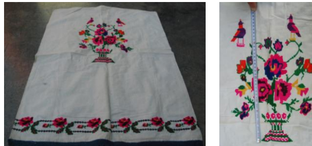
Görsel 2. Elbise örtüsü 2 (H. F. Akpınarlı fotoğraf arşivi, 2010)

Örnek 1'deki elbise örtüsünde; beyaz zemin üzerinde bitkisel bezemelerden lale, dal, yaprak motiflerinin, figürlü bezemelerden keçi motiflerinin, sembolik bezemelerden şahmeran motifinin hakim olduğu görülmektedir. Kompozisyon açısından değerlendirildiğinde; tam rapor düzenine sahip birbirine karşılıklı bakan keçi motiflerinden ve keçi motiflerinin alt kısmında bordür şeklinde lale, dal, yaprak motifleri yer almaktadır. Kumaşın zemininde beyaz renk hakim, motiflerde ise açık mavi, pembe, turuncu, sarı, siyah, açık yeşil, koyu yeşil, mor, koyu mavi renkler kullanılmaktadır. Motiflerin yapımında çin iğnesi ve iğne ardı işleme teknikleri, uç kısımda ise tığ örücülüğü dantel yer almıştır.