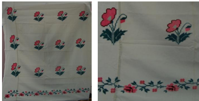
Görsel 8. Elbise örtüsü 8 (Akpınarlı v.d., 2012, s. 259)

Örnek 7'deki elbise örtüsünde; beyaz zemin üzerinde bitkisel bezemelerden çiçek motiflerinin hakim olduğu görülmektedir. Kompozisyon açısından değerlendirildiğinde; yüzeyde ayna simetri rapor düzeni kullanılmaktadır. Kumaşın kenarlarında bordür şeklinde yer alan motifler bulunmaktadır. Kumaşın zemininde beyaz, motiflerde ise mor renk tercih edilmiştir. Elbise torbası ön ortasından açık şekilde tasarlanmıştır. İşleme tekniklerinden kaneviçe kullanılmıştır.