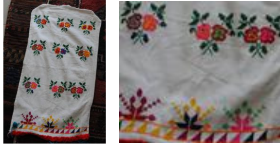
Görsel 4. Elbise örtüsü 4 (Akpınarlı v.d., 2012, s. 254)

Örnek 3'teki elbise örtüsünde; beyaz zemin üzerinde bitkisel bezemelerden çiçek, dal, yaprak motiflerinin, nesneli bezemelerden cami, minare, vazo motiflerinin hakim olduğu görülmektedir. Kompozisyon açısından değerlendirildiğinde; yüzeyde ayna simetri rapor düzeni kullanılmaktadır. Tasarımda cami motifi üst kısımda, vazoda çiçek dal, yaprak motifleri alt kısımda ve sağ ve sol tarafta karşılıklı minareler yer almaktadır. Kumaşın zemininde beyaz renk hakim, motiflerde ise açık yeşil, kırmızı, koyu mavi, açık mavi, turuncu, pembe, koyu yeşil, siyah, sarı renkler ve işleme tekniklerinden kaneviçe kullanılmıştır.