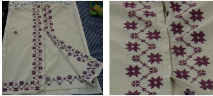
Görsel 7. Elbise örtüsü 7 (Akpınarlı v.d., 2012, s. 257)

Örnek 6'daki elbise örtüsünde; beyaz zemin üzerinde bitkisel bezemelerden çiçek, dal, tomurcuk motiflerinin, figürlü bezemelerden kuş motiflerinin hakim olduğu görülmektedir. Kompozisyon açısından değerlendirildiğinde; yüzeyde ayna simetri rapor düzeni kullanılmaktadır. Diyagonal olarak yerleştirilen çiçek, dal, tomurcuk motifleri karşılıklı olarak birbirine bakan müjdeli haber ve özgürlük sembolü kuş motifleri görülmektedir. Yazılı bezeme olarak örtünün sahibinin ismi işlenmiştir. Çoğunlukla damat giysileri için yapılan örtülerde isim yazıldığı belirtilmiştir. Kumaşın zemininde beyaz renk hakim, motiflerde ise pembe, siyah, koyu yeşil, kırmızı, turuncu, kahverengi renkler kullanılmaktadır. Motifler kaneviçe ve iğne ardı işleme tekniği ile yapılmıştır.