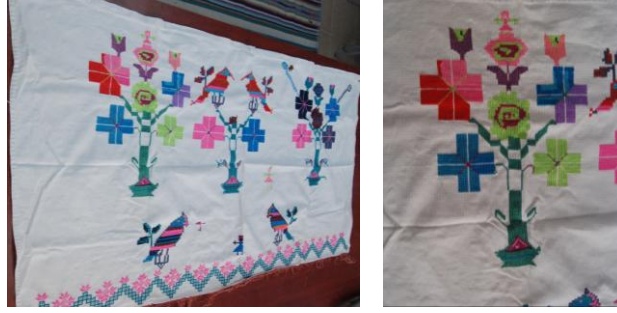
Görsel 14. Elbise örtüsü 13

Örnek 14'deki elbise örtüsünde; beyaz patiska kumaş üzerinde bitkisel, figürlü ve nesneli bezemeler görülmektedir. Saksı içinde geometrik hatlı çiçekler ve karşılıklı kuş ortasında insan figürü motifleri işlenmiştir. Motiflerde kırmızı, koyu mavi, turkuaz, pembe, mor, eflatun, açık yeşil, koyu yeşil ve sarı kullanılmıştır. Alt kısımda zikzak çizgilerin içinde bitkisel bezemelerden oluşan bordür yerleştirilmiştir. İşleme tekniklerinden kaneviçe kullanılmıştır.