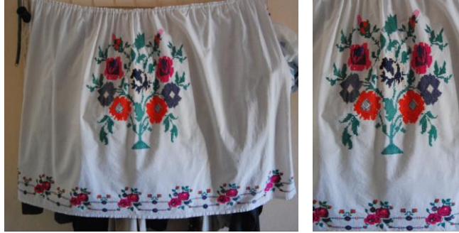
Görsel 13. Elbise örtüsü 13 (Akpınarlı v.d., 2012, s. 274)

Örnek 12'deki elbise örtüsünde; beyaz zemin üzerinde bitkisel bezemelerden çiçek, dal, yaprak motiflerinin, geometrik motiflerden diyagonal çizgilerin, nesneli bezemelerden vazo motiflerinin hakim olduğu görülmektedir. Kompozisyon açısından değerlendirildiğinde; yüzeyde tam rapor düzeni kullanılmaktadır. Kumaşın üst ve alt kısmında bordür şeklinde yer alan çiçek, dal, yaprak motiflerinin arasında diyagonal çizgiler görülmektedir. Aynı zamanda kumaşın yüzeyinde serbest düzende çiçek motifleri yer almaktadır. Kumaşın zemininde beyaz renk hakim, motiflerde ise pembe, koyu yeşil, siyah, açık yeşil, mor, koyu mavi, sarı renkler kullanılmaktadır. İşleme tekniklerinden kaneviçe kullanılmıştır.