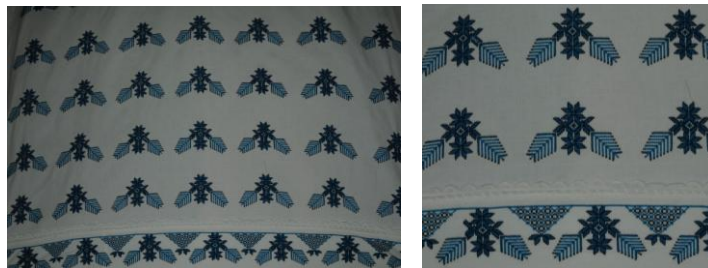
Görsel 11. Elbise örtüsü 11 (Akpınarlı v.d., 2012, s. 270)

Örnek 10'daki elbise örtüsünde; beyaz zemin üzerinde bitkisel bezemelerden çiçek, dal, yaprak, tomurcuk motiflerinin hakim olduğu görülmektedir. Kompozisyon açısından değerlendirildiğinde; yüzeyde tam rapor düzeni kullanılmaktadır. Kumaşın alt kısmında bordür şeklinde yer alan çiçek dal, yaprak, tomurcuk motifleri görülmektedir. Kumaşın zemininde beyaz renk hakim, motiflerde ise pembe, koyu yeşil, açık yeşil, sarı, mor renkler kullanılmaktadır. Motifler kanaviçe tekniği ile yapılmıştır. Uç kısmında tığ örücülüğü dantel kullanılmıştır.