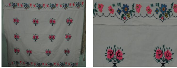
Görsel 12. Elbise örtüsü 12 (Akpınarlı v.d., 2012, s. 271)

Örnek 11'deki elbise örtüsünde; beyaz zemin üzerinde bitkisel bezemelerden lale, çiçek, dal, yaprak motiflerinin, geometrik bezemelerden daire, düz çizgi ve üçgen motiflerinin hakim olduğu görülmektedir. Kompozisyon açısından değerlendirildiğinde; yüzeyde birim rapor düzeni kullanılmaktadır. Kumaşın üst kısmında bordür şeklinde yer alan lale, çiçek, dal, yaprak motiflerinin arasında üçgen motifler görülmektedir. Kumaşın zemininde beyaz renk hakim, motiflerde ise koyu mavi, açık mavi, siyah, kahverengi, sarı renkler kullanılmaktadır. İşleme tekniklerinden kaneviçe kullanılmıştır.