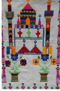
Görsel 3. Elbise örtüsü 3 (Akpınarlı v.d., 2012, s. 253)

Örnek 3'teki elbise örtüsünde; beyaz zemin üzerinde bitkisel bezemelerden çiçek, dal, yaprak motiflerinin, nesneli bezemelerden cami, minare, vazo motiflerinin hakim olduğu görülmektedir. Kompozisyon açısından değerlendirildiğinde; yüzeyde ayna simetri rapor düzeni kullanılmaktadır. Tasarımda cami motifi üst kısımda, vazoda çiçek dal, yaprak motifleri alt kısımda ve sağ ve sol tarafta karşılıklı minareler yer almaktadır. Kumaşın zemininde beyaz renk hakim, motiflerde ise açık yeşil, kırmızı, koyu mavi, açık mavi, turuncu, pembe, koyu yeşil, siyah, sarı renkler ve işleme tekniklerinden kaneviçe kullanılmıştır.