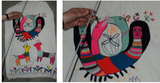
Görsel 1. Elbise örtüsü 1 (Akpınarlı v.d., 2012, s. 269)

Araştırma kapsamında Şanlıurfa yöresinde tespit edilen birbirinden farklı tasarıma sahip elbise örtüsü örnekleri incelenmiştir. Elbise örtülerinde kumaş olarak Patiska veya ağartılmış Amerikan bezi kullanılmıştır. Yöredeki kaynak kişilerin belirttiğine göre ucuz çabuk yıkanabilen kolay temin ettikleri kumaşları ve beyaz rengi tercih ettiklerini belirtmişlerdir. Elbise örtülerinde iki şekil ile karşılaşmıştır. Elbiseleri içine geçirilecek torba gibi dikilmiş örtüler veya düz olarak dikilmiş üst tarafından iplik ve lastik yeri yapılarak, büzgü ile elbiselerin üstünü örten örtülerdir. Örtülerin motif, kompozisyon ve renk özellikleri ayrıntılı olarak aşağıda yer almaktadır.