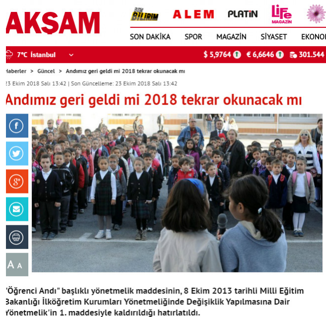
Şekil 6: Öğrenci Andı ile İlgili 23 Ekim 2018 Tarihli Akşam Gazetesi Haberi