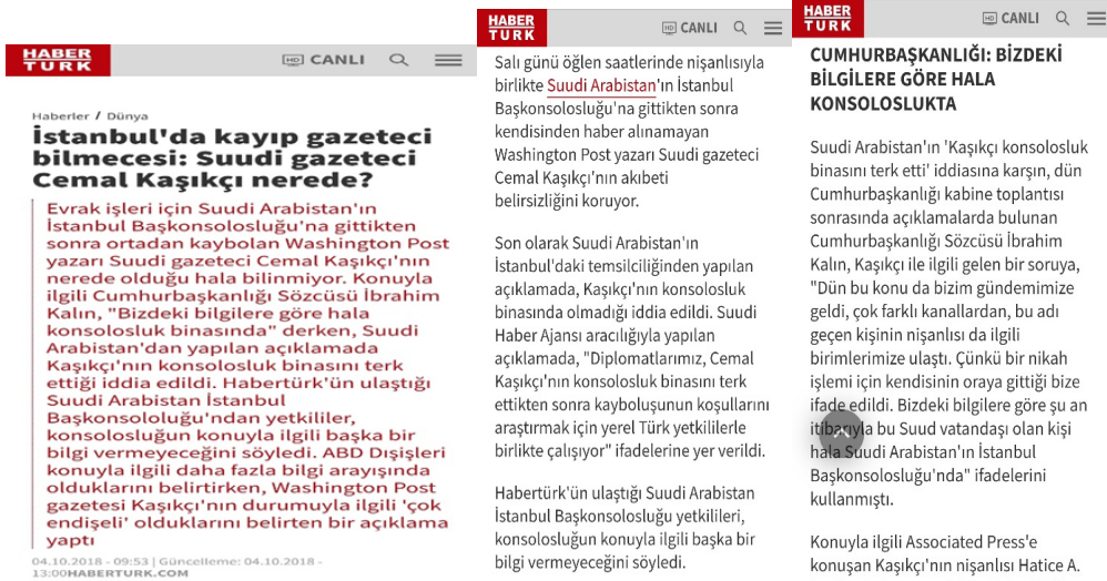
Şekil 1: Habertürk Sitesi'nin İncelenmesi (4 Ekim 2018 Tarihli Haber)

Dünya kamuoyunun, uluslararası kurum ve kuruluşlarının da bu soruşturma ve kovuşturma aşamalarını takip ettiğini göz önünde bulundurarak gazetecilerin, etik ilkelere riayet etmesi buna uygun bir habercilik anlayışı geliştirmesi gerekliliği önem kazanmaktadır. Belli kıstaslar bağlamında incelenen haber metninin daima etik anlayış çerçevesinde şekillendiğini söylemek mümkün olmamaktadır. Son olarak Cemal Kaşıkçı cinayeti hakkında yapılan basın açıklamaları ve haberleri incelenirken; medyanın haber ürettikleri endüstriyel şartlarının haberlerinin yazım dili, kurgusu ve ilkeleri göz ardı etmesine bunun da gazetecinin bağımsız olmadığı sonucuna varılmasına yol açtığı yorumlanmıştır. Medyanın önce güç odaklarına değil halka karşı sorumluluk duyarak görevini ve sorumluluklarını yerine getirmesi gerekirken, gazetecilik endüstrisinin hâkim ideoloji ve güç çerçevesinde şekil alması bunu zorlaştırmaktadır.