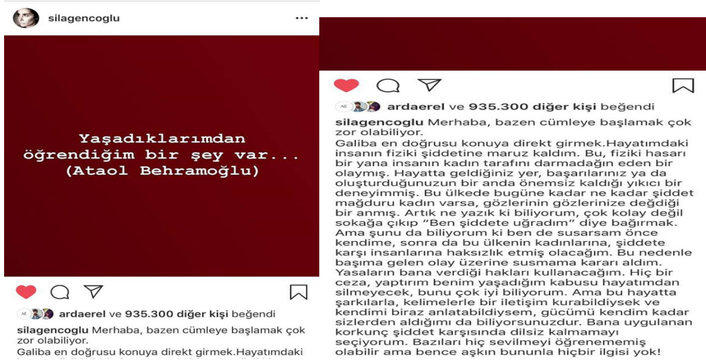
Şekil 3: 1.1.1018 Tarihli Sıla Gençoğlu'nun Instagram Hesabından Yapılan Açıklama