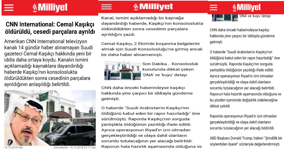
Şekil 2: Milliyet Gazetesinin İncelenmesi (16 Ekim 2018 Tarihli Haber)