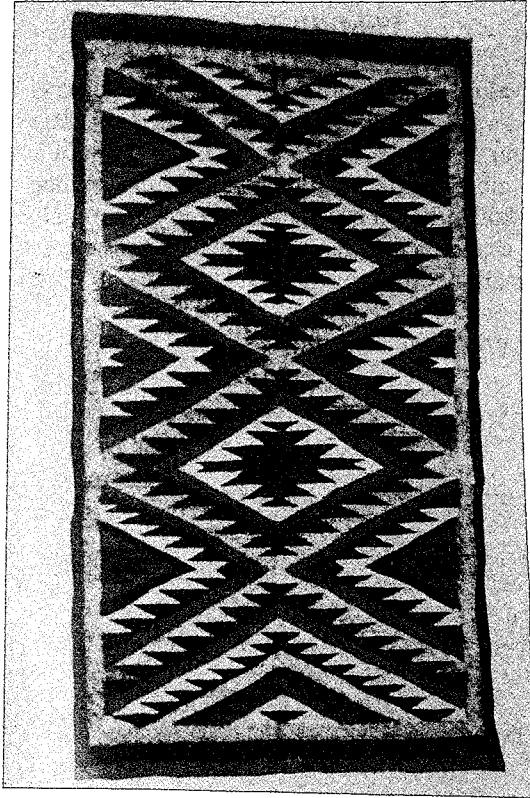
Res.1. Navajo Kilim, 1896, C.N. Cotton Kataloğu