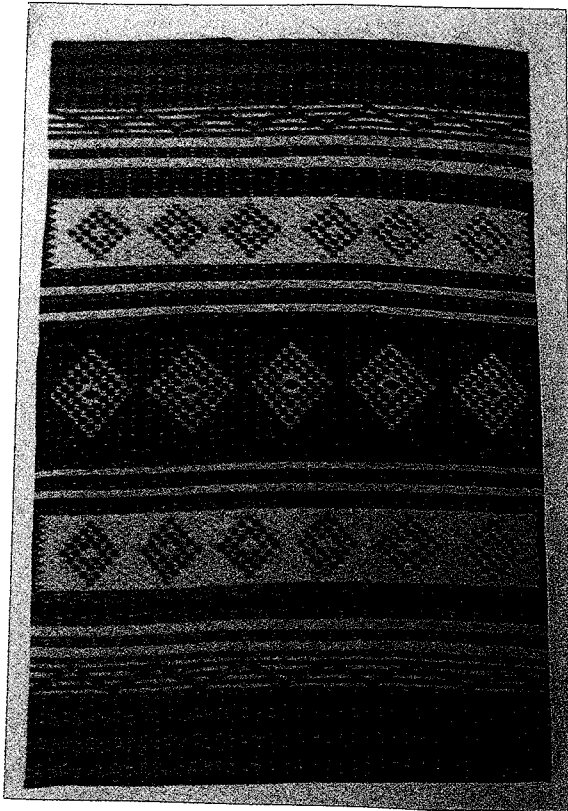
Res.2. Navajo Kilim, 1903, John B. Moore Kataloğu