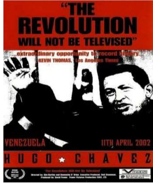
Görsel.3) "The Revolution Will Not Be Televised" Belgeselinin Afişi

Belgeselde daha sonraki görüntülerde Chavez'in helikopterle başkanlık Sarayına gelişi verilir. Burada Chavez, kendisini karşılamada görevli olan bir saray muhafızı ile sevecen biçimde konuşmaktadır. Görüntülerde darbe gerçekleşikten sonra halkla birlikte Başkanlık Sarayı'nın tekrar ele geçirilmesinde etkin rolü bulunan saray muhafızlarının Chavez'e duydukları sevgi ve bağlılığın nedenlerine gönderme yapılmaktadır. Bu görüntülerin sonrasında başkanlık sarayı çalışanlarının röportajları gelmektedir. Halktan gelen talepleri inceleyen çalışanlar, bunları uygun biçimde arşivlemektedirler. Raflar ve dosyaları dolusu olduğu görülen bu taleplerin çoğunda iş, ekonomik yardım vb. konular mevcuttur. Bu durum aslında doğal kaynaklar bakımından zengin bir ülke olan Venezuela'nın gelir dağılımındaki eşitsizliği ve halkın çoğunluğunun yoksul ve yardıma muhtaç olduğunu göstermektedir.