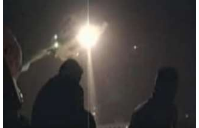
Görsel.6)The Revolution Will Not Be Televised belgeselinden bir kare

Buradaki görüntülerde de yine ışık ve karanlık vurgusu göze çarpmaktadır. Gece karanlığında bir araca bindirilerek, yine karanlıklar içine doğru yol alan Chavez, adeta kutsal ya da mitolojik bir kahraman gibi gece karanlığında gökyüzünden ışık saçarak inmiş ve halkın arasına karışmıştır. Halkın kendisine olan sevgisi ve bağlılığı, onu karanlıklardan geri getirmeye muktedir olmuştur. Diğer yandan yine Hristiyan inancındaki Hazreti İsa'nın çarmıha gerilerek öldükten 3 gün sonra dirilmesi inancı ve Rönesans dönemi ressam ve heykeltıraşlarının İsa'nın dirilişi konulu eserleri ile görsel bakımdan benzerlik gösteren bu olay; demokrasi ve halk iradesinin gücüne de kutsallık kazandıran bir anlam taşımaktadır.