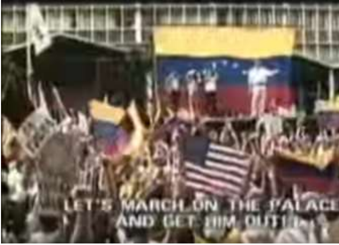
Görsel.4) The Revolution Will Not Be Televised belgeselinden bir kare

Venezuela Bayrağı ve çeşitli pankartların yanı sıra Amerikan bayrakları da görülmektedir.