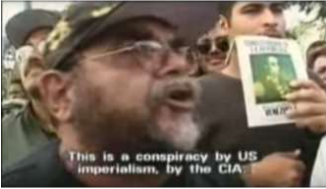
Görsel.5) The Revolution Will Not Be Televised Belgeselinden bir kare

Diğer yandan Chavez taraftarlarının ellerinde de Venezuela bayrakları mevcuttur, bunun yanı sıra Chavez fotoğrafları ve ülkenin emperyalizme karşı bağımsızlığının kazanılmasını sağlayan SimonBolívar'ın resimlerini taşımaktadırlar.