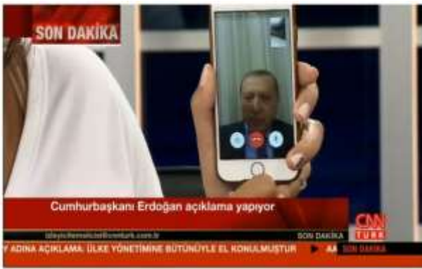
Görsel.2.) 15 Temmuz Destanı adlı belgeselden bir kare

Belgeselde daha sonra Cumhurbaşkanı Recep Tayyip Erdoğan'ın kendisini ölü ya da diri ele geçirmek isteyen darbeci askerleri nasıl atlattığı anlatılmış ve sonrasında bu girişime karşı topyekün bir direniş gösterilmesi için CNN TÜRK televizyonunda bir akıllı telefon uygulaması olan FaceTime 4 ile gerçekleştirdiği canlı bağlantıya yer verilmiştir. Söz konusu görüntü, yeni medya ile geleneksel medyanın amaç, teknoloji ve etki bağlamında yakınsadıkları, tarihsel öneme sahip bir ana vurgu yapmaktadır. Aynı zamanda eldeki kısıtlı imkanlar doğrultusunda halka direnişe geçme ve darbecilere ise seçilmiş yöneticiler olarak boyun eğilmeyeceği mesajının verilmesi anlamında bir kararlılığı da göstermektedir.