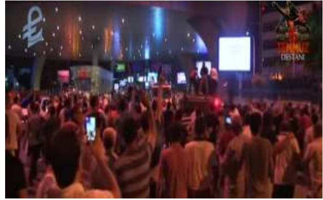
Görsel.1) 15 Temmuz Destanı belgeselinden bir kare.

Bununla birlikte halkında küçük gruplar halinde bu duruma direniş göstermeye başladığı görülmektedir. İstanbul Atatürk Havalimanı'na el koyan darbeci askerleri protesto etmeye giden halkı gösteren görüntüler de dikkat çeken en önemli detaylardan biri de vatandaşların akıllı telefonları ve amatör kameralarıyla olup biteni kaydetmesidir.