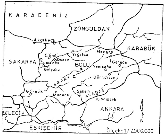
Şekil 1. Araştırma Sahasının Lokasyon Haritası

Köroğlu Dağlarıdır ki Bolu'nun güneyindeki uzantısı Seben Dağları ile daha batıda Ardıç Dağlarıdır. Bu dağların arasında doğuya doğru ortalama yükselteleri artan Düzce, Bolu ve Gerede ile daha güneyde Mudurnu ve Himmetoğlu Ovaları yer alır.