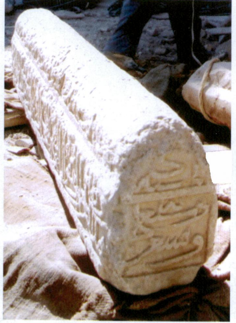
Resim 5- Mehmed Bey'in Mezar Taşının 7. ve 8. yüzü