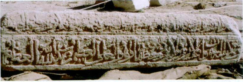
Resim 2- Mehmed Bey'in Mezar Taşının 1. ve 3. yüzü