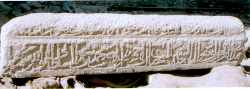
Resim 3- Mehmed Bey'in Mezar Taşının 2. ve 4. Yüzü