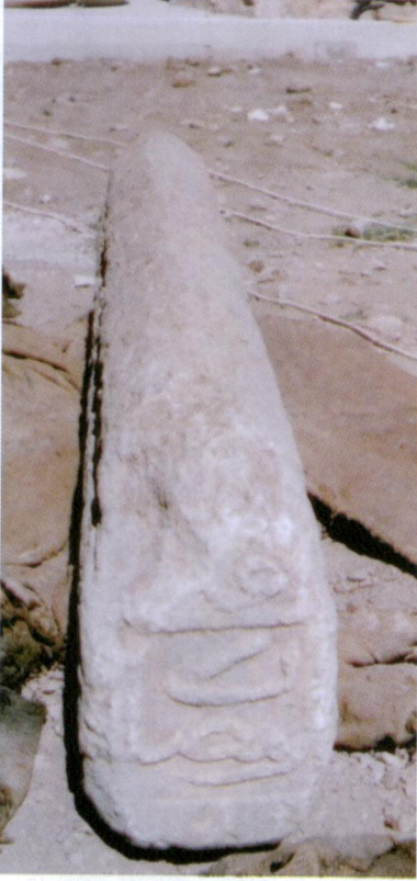
Resim 4- Mehmed Bey'in Mezar Taşının 5. ve 6. yüzü