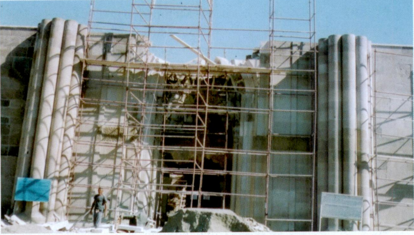
Resim 1- Restorasyon halindeki Kayseri Sultan Hanı Portali