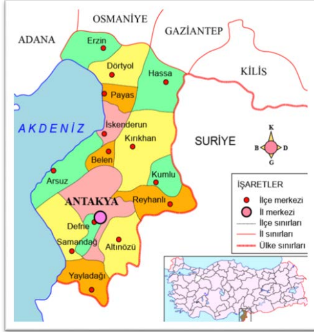
Harita 2. Hatay İli Haritası