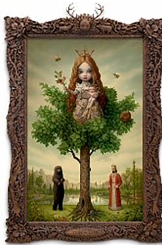
Görsel 2. Mark Ryden, 2006, Hayat Ağacı/The Tree Of Life, Tuval üzerine yağlıboya, 168x107 cm, (Michael Kohn Galerisi, ABD)

Akımın öncü sanatçılarından Mark Ryden, illüstrasyon üzerine eğitim almıştır. Resimlerinde pop kültür öğelerini sıklıkla kullanan Ryden'in diğer temaları; Hollywood yıldızları, dini sahneler, çizgi filmlerdekilere benzer karakterler, karanlık temalar, Erken Rönesans-Gotik dönem örneklerini anımsatan peyzajlardır. Bu karakterlerin oldukça çocuksu ve sempatik görünüşlerinin altında her zaman tekin olmayan bir hal vardır ve görüntülerinin tam zıttı temalarla ilgilidirler. Resimlerinde görülen sevimli olduğu kadar rahatsız edici çocukluk masumiyeti sanatçının ruhunun gizemini ortaya koymaktadır (bkz. Görsel 1-2) New York Times gazetesine göre 'Ryden'in