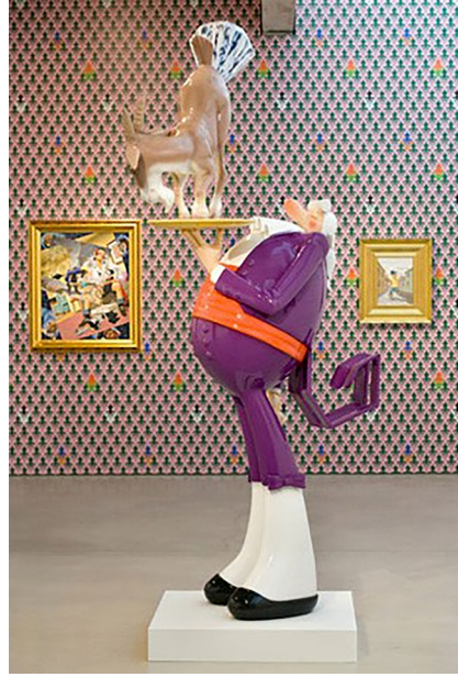
Görsel 8.Robert Williams, 2009, Keçi Kıçında Elmas/Diamond in a Goat's Ass, Yerleştirme, (Tony Shafrazi Galerisi, ABD)

Robert Williams'ın destansı, karikatüre benzeyen resimleri ve düzenlemeleri Amerikan üslûbundan ve görsel argolardan alınmıştır. Williams eserlerinde; işçiliğe, figürasyona ve popüler imgelere odaklanmıştır. Çalışmalarını, sosyal yorumları için; somut, ilişkilendirilebilir ve genellikle saçma, absürt olarak nitelendirilen görüntülere dayandırmıştır. Resimlerindeki çizgi film esprisi heykellerinde de devam etmektedir.(bkz. Görsel 7-8) Sosyal içerikli bu çalışmalarıyla sanatçı, aynı zamanda bazı yüzleşmeler ve kafa karışıklıkları da yaratmaktadır. Tüm bu ifadeler, 'yüksek' sanat dünyasına muhalif tutumlardır.