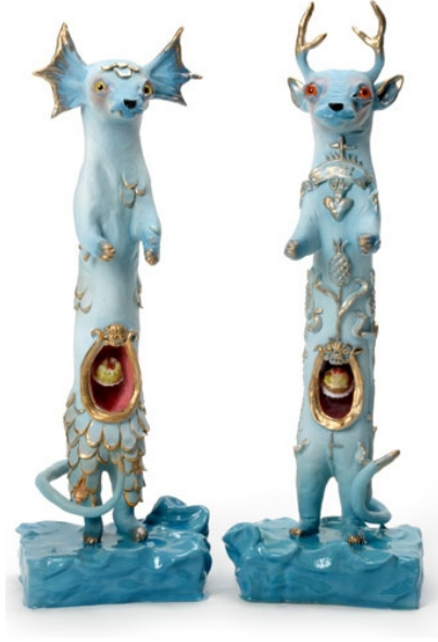
Görsel 9.Elizabeth McGrath, 2009, Gelincikler/The Weasels, Karışık teknik, 15x46x10 cm, (Corey Helford Galeri, ABD)