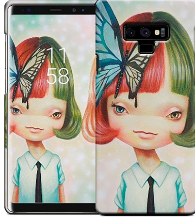
Görsel 6.Yosuke Ueno, Makas ve Kelebek/Scissors and Butterfly Gelaskin telefon uygulamaları

Gençlik yıllarında ölüm, üzüntü ve psikopatoloji gibi konularla daha olumsuz ve karanlık resimler yapan Yosuke Ueno,20’li yaşlarından sonra daha pozitif, sevgi ve ışıkla eserler yaratmaya başlamıştır. Bu kararı, dünyada zaten yeteri kadar acı ve olumsuzluklara maruz kaldığı anlayışıyla vermiştir. Ueno’nun sanatı, 2011’de Japonya’yı harap eden Tsunami ve depremlerle daha da şekillendi. Bu trajediden sonra eserlerini sevgi ve umudu çağırma girişimleriyle ortaya koydu. Ueno, özellikle masum görünümlü canlı renklerle ve sembolik bir dille oluşturduğu stili ile tanınmıştır. Ueno’nun sanatında; geleneksel Japon kültüründen, Tokyo’nun sokak modasından, dünyanın dört bir yanındaki sanat eserlerine ve sanat tarihinin başyapıtlarına kadar izler görülebilmektedir. Özellikle Japon kültürü, Yosuke’nin eserlerindeki ana etkilerdir. Manga, anime, Budist heykelleri vs. konulardan oldukça etkilenmiştir. Sanatçının çok sayıda yarattığı özgün, stilize, eşsiz ve orijinal karakterleri, Japon manevi inanç sistemleriyle bağlantılıdır. Ueno’nun çalışmalarının öne çıkmasının nedenleri; ilginç bir şekilde yan yana diziler, gizli sembolizm ve yinelenen metaforlardır. Sanatçı adeta, sembolik sistemi ile alternatif bir gerçeklik, tekrarlayan karakterler ve tekrarlanan motifler içeren sıkıca örülmüş bir evren inşa etmiştir (“Widewalls”, 2015).