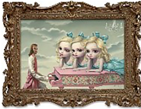
Görsel 1. Mark Ryden, 2010, Piyano Adamı/The Piano Man, Tuval üzerine yağlı boya, 51x76 cm, (Paul Kasmin Galerisi, ABD)

Pop Sürrealizm'in genel olarak anlatım tekniği resim ve illüstrasyondur; fakat hızla yaygınlaşan bu bağımsız akım özellikle günümüzde heykel, vinil oyuncaklar, seramik ve mekân yerleştirmeleri olarak da görselleştirilir. Konularını daha çok popüler kültür elemanları, grotesk biçimler, animatik karakterler ve sarkastik yaklaşımlar oluşturur. 1990'larda akım Amerika'dan sonra Avrupa ve Uzak Doğu ülkelerinde de yer bulmuş ve başta illüstrasyon sanatçıları olmak üzere çok çeşitli disiplinlerde üreten pek çok kişiyi etkisi altına almıştır. 2000'li yıllarda illüstrasyon, karakter tasarımı ve pop-sürrealist yaklaşımların reklam filmlerinden, animasyona, basılı tasarım işlerinden üç boyutlu yapıtlara kadar her alanda yer aldığı görülebilir. 2000'den sonrası bu sanat hareketinin altın çağı olarak anılmaktadır (Ergen, 2015, s. 176).