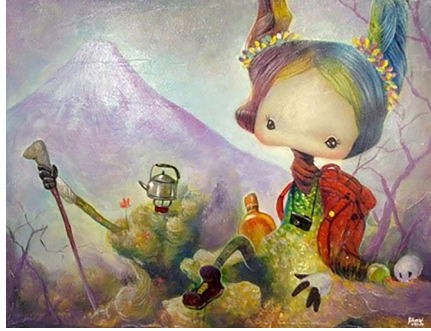
Görsel 3. Yosuke Ueno, 2012, Dağ Oluyorum/I Become Mountain, Tuval üzerine akrilik, 32x24 cm

Lowbrow Sanat Hareketi, ağırlıklı olarak genç sanatçıların kendilerini gösterdiği bir platform olarak gözlemlenmektedir. Aynı şekilde, izleyici kitlesini de genç kuşak oluşturmaktadır. Popüler bir kültür oluşumu olması itibariyle, aynı dili konuşan, algısı ve yorumu paralel olan (çağdaş) insanlar arasında üretilip ve tüketilmektedir. Ancak akım, popüler kültürün sanatçıları yönlendirmesinde, güncel bir örnek olarak incelemeye değerdir. Özellikle gençler arasında, tıpkı pop müziğin ikonlaşan yüzleri gibi, sanatçıların eserleri, internet bazlı paylaşım sitelerinde, profil imajı olarak kullanılmakta, bilgisayar ve cep telefonlarını kişiselleştirmekte ve popülerize edilmektedir. Ortaya konulan eserlerde, uygulama alanı geniş ve esnektir. Eserler, farklı yüzeylere de uygulanabilmektedir. Bu uygulama ile eser, sanatsal değerinden bir şey kaybetmez, tam tersi, bu şekilde oluşturulan bir sergiye, canlılık ve zenginlik katmış olur (Başkent, 2010, s. 62-80).