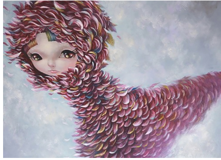
Görsel 4. Yosuke Ueno, 2013, Pembe Bagworm/Pink Bagworm, Tuval üzerine akrilik, 46x61 cm