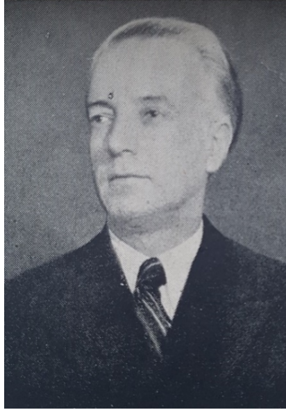
Görsel 3. Radyo Çocuk Saati Müzik Mütahassısı Halil Bedii Yönetken ( Ankara Radyosu Çocuk Saati Çalışmaları , 1954)

Yönetken, eğitimci, folklorcu, müzik yazarı, flüt sanatçısı ve eğitim müziği bestecisi...1917'de İstanbul Muallim Mektebi'ni bitirmiş, mesleğine İstanbul ve Bursa'daki çeşitli okullarda müzik öğretmenliği yaparak başlamıştır. 1928'de devlet bursuyla Çekoslovakya'ya gönderilen Yönetken, Prag Konservatuvarı'nda müzik eğitimi öğrenimi yapmış, çalışmalarını Paris ve Berlin'de kurslara katılarak sürdürmüştür. Ankara'da Musiki Muallim Mektebi'nde ve Ankara Lisesi'nde müzik öğretmeni olarak çalışmış, 1936'da Ankara Devlet Konservatuvarı'nın kurulması üzerine bu okulda teori, solfej ve koro dersleri vermiştir. 1938'den itibaren Gazi Eğitim Enstitüsü Müzik Şubesi'nde eğitimci olarak görev yapan sanatçımız, 1935 yılından itibaren düzenli folklor çalışmalarına katılmış, 1937-1951 yılları arasında Ankara Devlet Konservatuvarı'nın gerçekleştirdiği halk müziği derleme çalışmalarında yer almıştır (Say, 2005, s. 647- 648).