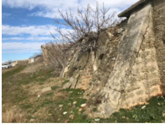
Resim 17. Bolayır Merkez Tabyasının Dış Cephe Tahribatından Görünüm