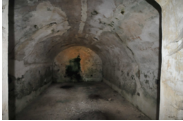
Resim 10. Tabyanın Bonetlerinden İçerisinden Görünüm