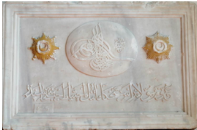
Resim 3. Karagah Binasının Gelibolu Mevlivhanesinde Muhafaza Edilen Kitabesi