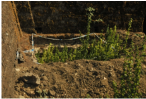
Resim 21. Tabyada Yapılan Kaçak Kazı Tahribatından Görünüm