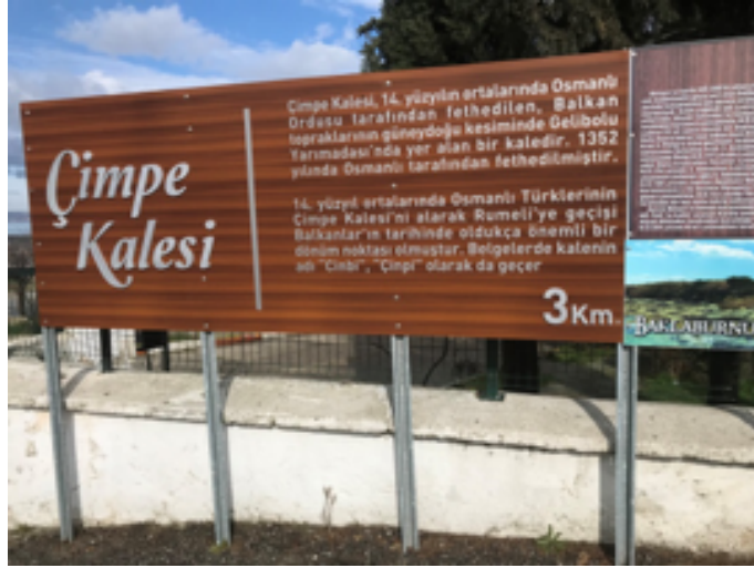
Resim 1. Gelibolu Belediyesinin Ziyaretçiler için Koyduğu Yönlendirme Tabelası