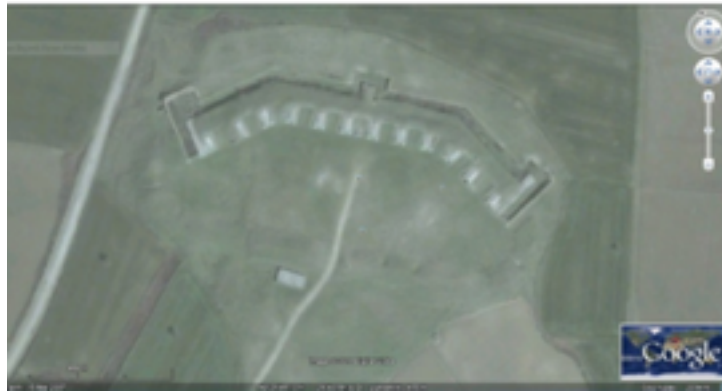
Resim 2. Google Earth Üzerinden Bolayır Merkez Tabyasının Görünümü