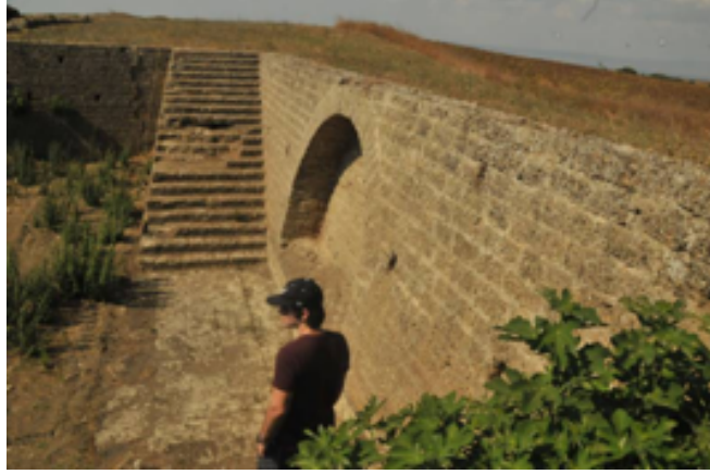
Resim 5. Tabyanın Hendeğinin Kuzeydoğu Ucunda Bulunan Merdiveni