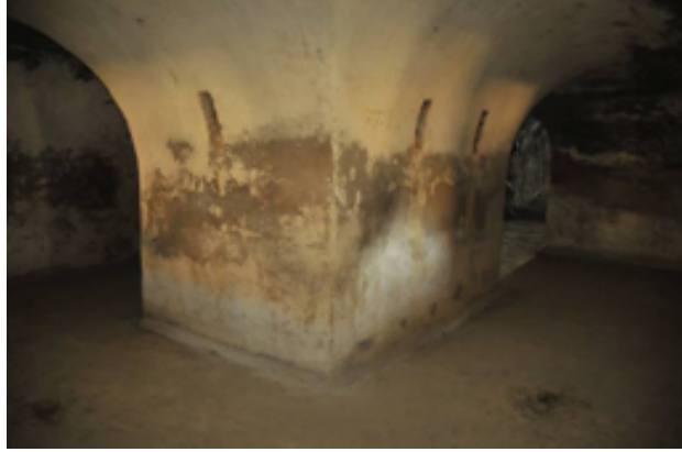
Resim 9. Pusu Odasının Ortasında Bulunan Kalın Destek Ayağı