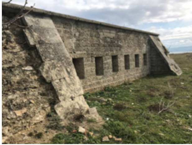
Resim 14. Tabyanın Pusu odasının Dış Duvarı ve Mazgal Pencereleri