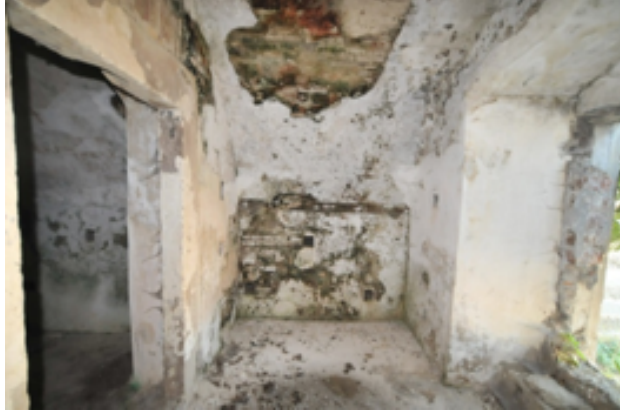
Resim 13. Pusu Odasının Önünde Bulunan Karşılıklı Girintili Bölümlerden