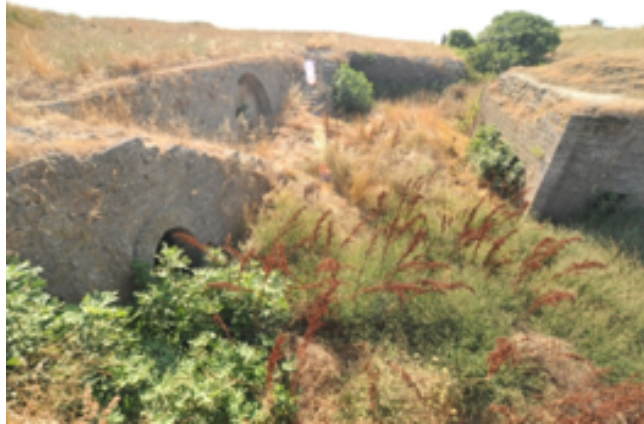
Resim 6. Tabyanın Hendeğinde Merdivenlerin Altında Açılan Odalardan Birisi