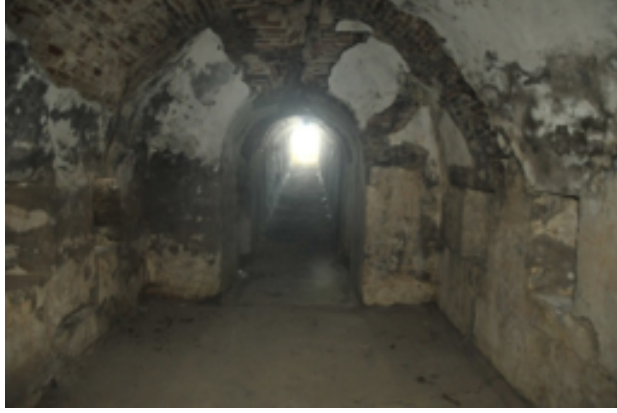
Resim 7. Tabyanın Kuzeydoğu Ucunda Bulunan Pusu Odasının Koridoru