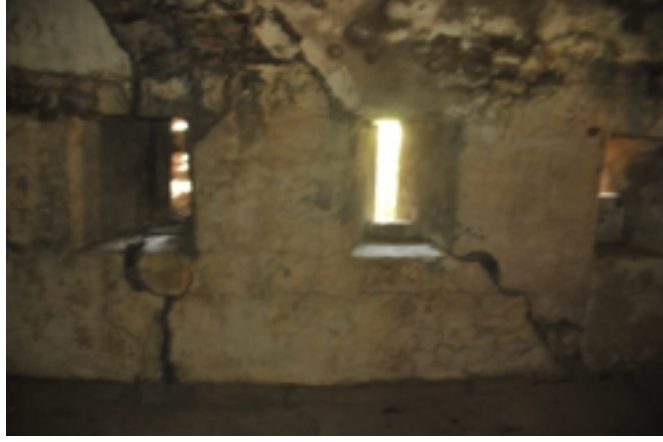
Resim 19. Tabyanın İçerisinden Görünüm