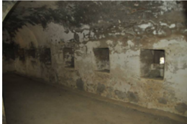
Resim 12. Pusu Odasının Mazgal Penceresi