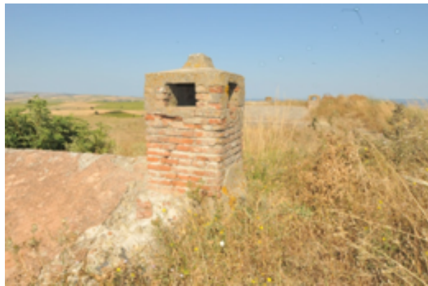
Resim 15. Tabyanın Üst örtüsü ve Ayakta Kalan Bacalarından Bir örnek