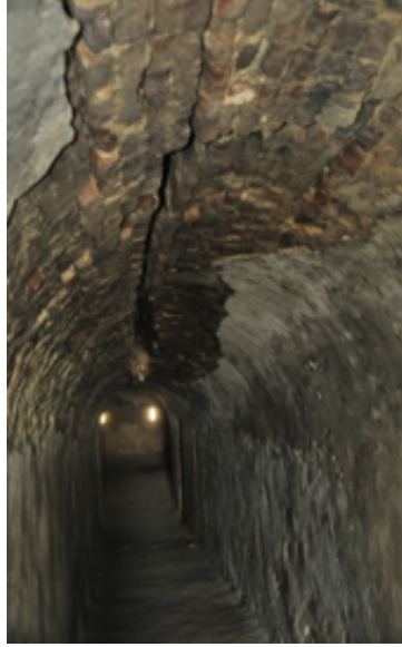
Resim 20. Tabyanın İçerisinden Görünüm