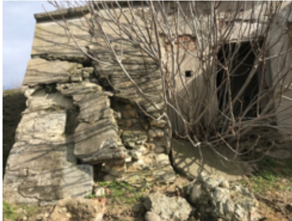
Resim 18. Bolayır Merkez Tabyasının Dış Cephe Tahribatından Görünüm