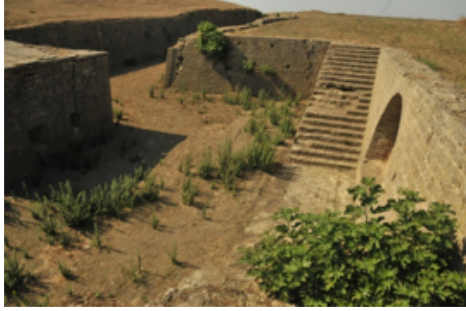
Resim 4. Tabyanın Hendeğinden Genel Görünüm