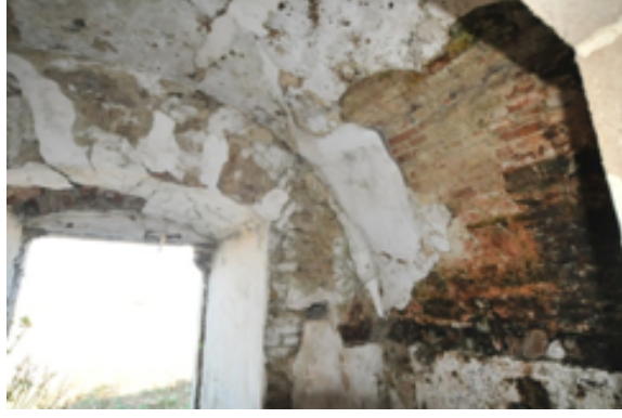
Resim 16. Tabyanın İnşaatında Kullanılan Tuğla ve Sıva Örneği