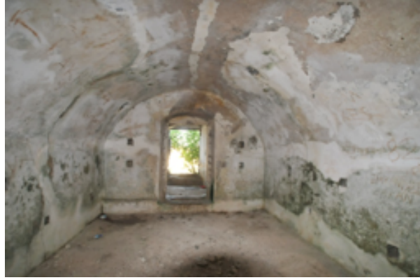
Resim 11. Tabyanın Bonetlerinden İçerisinden Görünüm