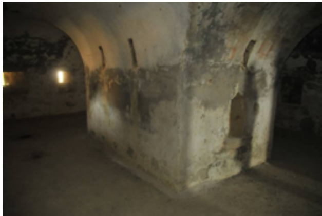
Resim 8. Tabyanın Kuzeydoğu Ucunda Bulunan Pusu Odası Ortadaki Kalın Ayak