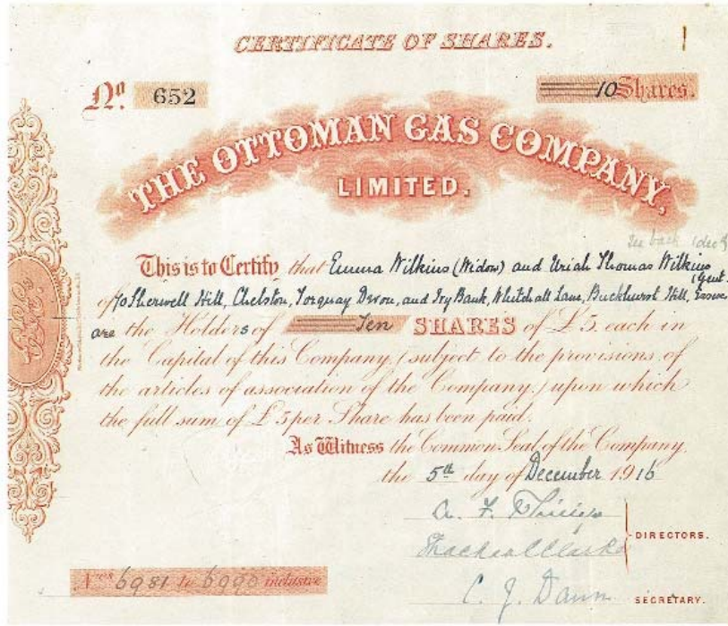
Şekil 3a Osmanlı Gaz Şirketi, 1916.

Tahvil ve hisse senetlerinden hareketle şirketin ismi, kuruluş tarihi, merkezi, müddeti, sermayesi ve müessisleri gibi temel bilgilere ulaşmak mümkün olabilmektedir. Bazen varlığından bile haberdar olunamamış, hakkında herhangi bir bilgiye ulaşılammış bir şirketi bir hisse senedi sayesinde tespit edebilir (bkz. Şekil 3a/4a) 14 ya da temin edilebilen bir tahvilden şirketin merkezi, sermayesi, çıkarılan tahvil miktarı, değeri faiz oranı vb. bilgileri belirleyerek bir başlangıç yapabilir, verdiği faiz oranına bakarak şirket ve dönemi hakkında çıkarımlar yapabiliriz ( bkz. Şekil 3b/4b) 15 .