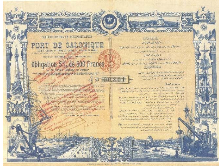
Şekil 4 b Selanik Limanı İşletme Şirket-i Osmaniyesi, 20 Ocak 1905 tarihli 22 Osmanlı Lirası (500 Frank) değerinde %5 faizli tahvil