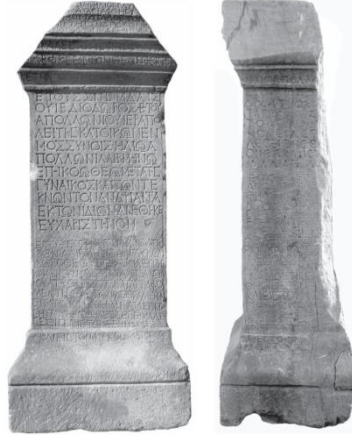
3. Mossyna ismi. Apollon Lermenos Tapınağı adası, (Öztürk-Tanrıver 2008:95).

bölgedeki arkeolojik bulgulardan da istifade etme zarurietiyi vardır. Nitekim arkeolojik kanıtlar arasında önemli bir yere sahip olan Apollon Lermenos tapınağı adaklarından biri üzerinde de Mossyna ismi geçmektedir. Yazıtta;