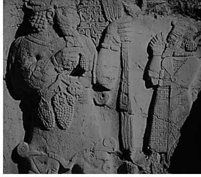
4. Üzüm. Kral Warpalavas'a ait Dvrıs Kaya Kabartması (MÖ 1200-742)

“..Ben hakim kahraman Warpalawas, sarayda bir prensken bu asmaları dektim. Tanrı Tarhundas onlara bolluk ve bereket versin...”