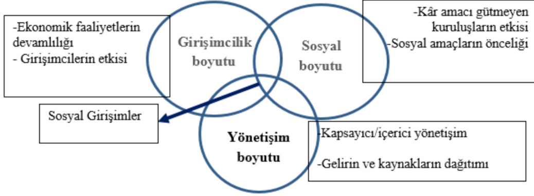
řekil 1. Sosyal Giriřimciliđin Ü Boyutu