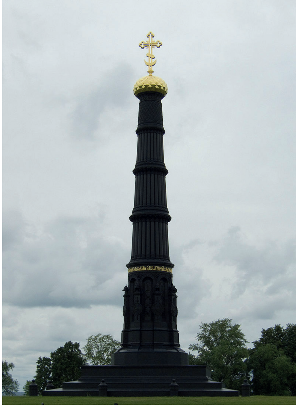
Resim 4. 1848'de Akademisyen A.P. Brulov'un teklifi ile dikilen Kulikovo Zaferini Ebedileştiren Anıt 5 ( http://photo-drive.ru/wordpress/kulikovskaya-bitva )

Kulikovo Savaşı'nı bir "tesadüf" olarak kabul eden ve Rusların çok güçlendikleri için değil de Altın Orda'nın fetret dönemini yaşadığı için galip geldiği de ileri sürülen görüşler arasındadır (Kamalov 2009: 102). Elbette ki Dmitriy bu zaferi Altın Orda bir duraklama dönemine girdiği için yaşamıştır ancak unutmamak gerekir ki yüzelliyıldan fazla bir zamandır hâkimiyeti altında buldukları bu devleti çok iyi tanıma fırsatını bularak ona karşı nasıl savaşacaklarını da anlamışlardır. Bu savaşın öncesinde yaşanan olaylara baktığımızda zaferi bir tesadüf olarak değerlendirmekten ziyade Rusların Altın Orda'yı ne kadar iyi tâkip ettiklerini ve onu ancak ona denk bir güçle yenebileceklerine olan inançlarının bu başarıyı getirdiğini ifade edebiliriz.