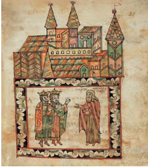
Resim 1. Metropolit Kiprian, Dmitriy ve Serpuhovlu Vladimir ile birlikte dua ederken

Tver Knyazlığı Moskova'nın hâkimiyetinde idi ve istenildiğinde askerî birlik göndermek zorundaydı. Dmitriy, bu zorunluluğu kendi knyazlığı için gurur verici olarak dillendirmiş, ama Şirokorad'ın ifadesi ile "Moskova için belki de en zor gününde bu şart yerine getirilmemiştir" (Şirokorad 2005: 173). Tver'in yanısıra, Novgorod ve Ryazan knyazları da yardım göndermemişler, ancak Mamay'ın tarafında da yer almamışlardır. Dmitriy bir yandan savaş için gerekli hazırlıkları yaparken; diğer taraftan Tatar tehlikesine karşı ortak bir Rus savunması oluşturmak gayesiyle Metropolit Kiprian'dan manevî yardım almıştır.