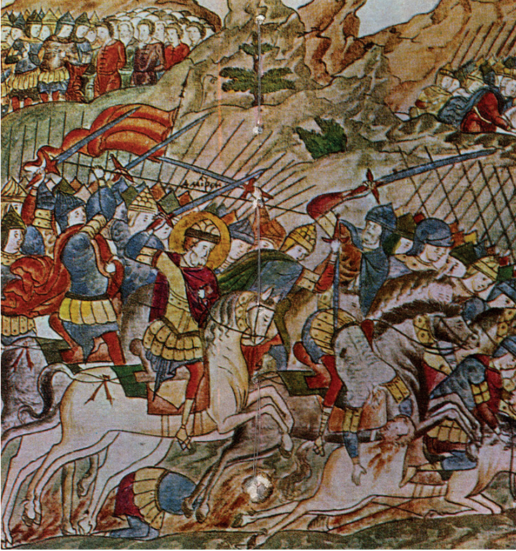
Resim 3. Kulikovo Savaşı ( http://konevodstvo.su/books )

ve fikirdaşları ile kaçtı. Ailesinin ona ordusunu göndermemesi ve kendi tarafında yer alarak savaş için sıraya girmesi için yalvardığını öğrendiğinde Büyük Knyaz bütün bunları umursamadı, ama bizzat kendisi üzerine gitmeyip Rus topraklarına geri dönerken genel valisini üzerine gönderdi. 4 ( Troitskaya Letopis 1950: 419-421)