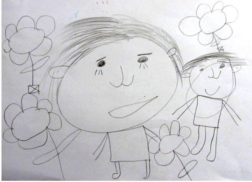
Resim 4: Öğrenci Çalışması

çalışmalar bireylerin duygu ve düşüncelerini, olaylara karşı gösterdikleri tepkileri olumlu yönde geliştirmelerine olanak tanımaktadır.