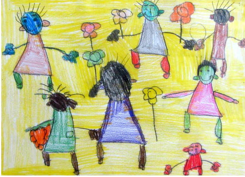
Resim 1: Öğrenci Çalışması

Resim 1’de yer alan unsurlar incelendiğinde, öğrencinin çalışmayı yaparken keyif aldığı ve hoş vakit geçirdiği yönünde bir takım işaretleri gözlemlemek mümkündür. Öğrencinin figürleri çizerken gösterdiği detaycı yaklaşım (kaş, göz, kulak, saç, el, kol vb.) çalışmayı sıkılmadan sürdürdüğü şeklinde yorumlanabilir. Ayrıca figürlerin tamamını güler yüzlü (mutlu) bir şekilde çizmesi de yaşadığı mutluluğun bir göstergesi olarak ifade edilebilir. Figürlerin arkasında kullandığı sarı renk, olumlu hislere sahip olduğu şeklinde yorumlanabilir. Çünkü Malchiodi’ye göre; saf sarı genellikle enerji, ışık ve olumlu hislerle ilişkilendirilir (Ece ve Çelik, 2008: 22).