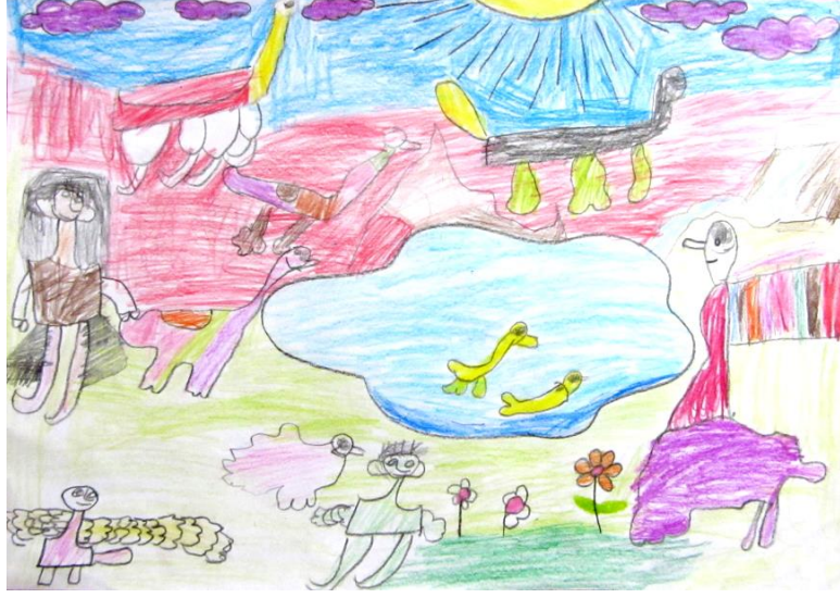
Resim 5: Öğrenci Çalışması

Resim 5'te yer alan öğrenci çalışması sahip olduğu enerji ile dikkat çekmektedir. Figürlerin ve renklerin yüzeye dağılım oldukça etkilidir. Çalışmada yer alan unsurların tamamı detaylı bir şekilde resmedilmiştir. Bu detaylar öğrencinin resmi sıkılmadan çalıştığını ve psiko-motor becerilerinin yüksek olduğunu göstermektedir. İnsan figürlerinin gülen ağızları dikkat çekici olmakla birlikte, asıl dikkat çekici olan nokta hayvan figürlerinin de gülen ağızlarına sahip olmasıdır. Öğrencinin görsel sanatlar dersi sırasında yaşadığı hazzı ve mutluluğu çalışmada görmek mümkündür.