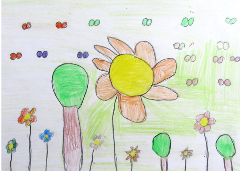
Resim 2: Öğrenci Çalışması

Resim 2, öğrencinin gözündeki doğayı izleyicilere aktaran bir çalışmadır. Arka planda yer alan daire formlu şekiller kelebekleri, yeşil yuvarlaklar ağaçların yapraklarını, kahverengi dikdörtgenler ise gövdelerini ifade etmektedir. İnce siyah çizgilerle ifade edilen gövdelerin üzerinde ise farklı renklerde çiçeklerin yer aldığı görülmektedir. Öğrencinin tercih ettiği formlar ve renklerden yola çıkarak, doğada yer alan bir takım nesnelere tanıdığı ve hatırlayarak resimlerine aktarabildiği söylenebilir.