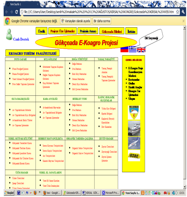
Şekil 6: Gökçeada E-Koagro Turizm Web Sitesi