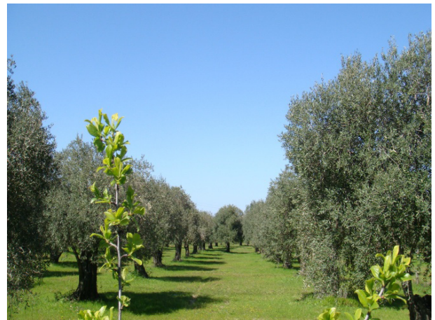
Şekil 5: Zeytinlik Köy, Zeytin Bahçesi

Binlerce yıllık ada hayvancılık kültürü hakkında bilgiler veren kurslar, hayvan üreticilerinin yanında