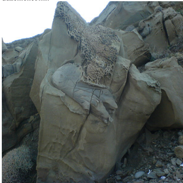
Kaynak: (Kalinska, 2011:1) Şekil 3: Yıldızkoy Kayalıkları

Binlerce yıllık ada mutfağına ait yemeklerin tanıtımı ve bunların yapılış teknikleri öğretici gastronomi kursları düzenlenebilir.