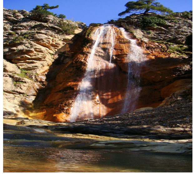
Şekil 4: Marmaros Şelalesi