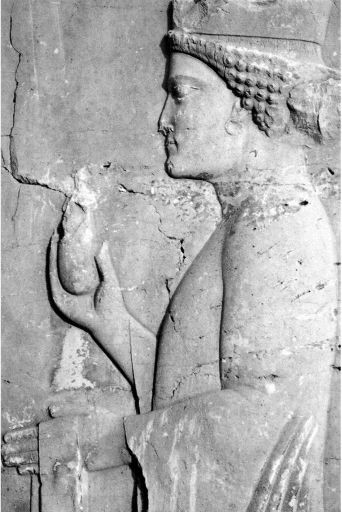
Şekil 2. Aynı kabartmadan detaylı görünüm (Llewellyn-Jones 2013, F 9).