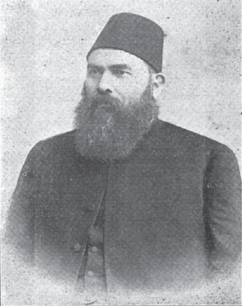
Ahmed Midhat Efendi (1844-1912)