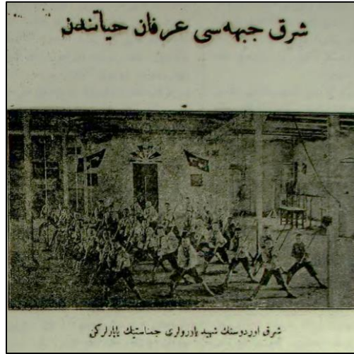
Şark Cephesi irfan hayatından

(Şark Ordusunun yetim yavruları jimnastik yaparlarken)