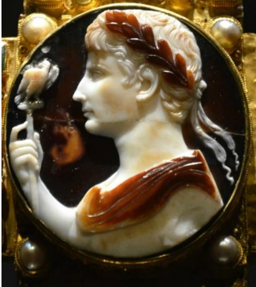
Resim 8: Geç Dönem Lothair Haçı

Almanya Aachen Cathedral Hazinesi koleksiyonunda sergilenen Geç Dönem Lothair Haçı (Barasch, 2001: 16, fig. 6) olarak adlandırılan objenin merkezine yerleştirilen gemma üzerinde İmparator Augustus betimlenmiştir ( Resim 8 ). MS 1. yüzyıla tarihlendirilen Augustus'un portresinin yer aldığı gemma Geç Dönem haç motifinin merkezine eklenmiştir. Augustus elinde kartal betimli asa tutmaktadır. Eser İmparatorlar aracılığıyla kullanımını destekleyen bir örnek niteliğindedir.