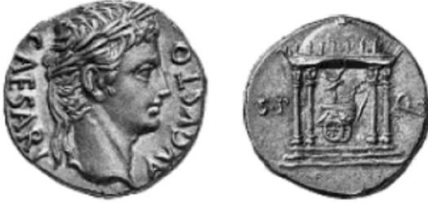
Resim 7: Augustus Dönemine Tarihlendirilen Gümüş Denarius