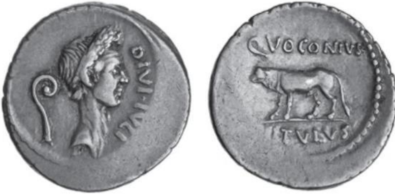
Resim 2: Iulius Caesar'ın Betimlendiği Gümüş Bir Denarius

Iulius Caesar'ın betimlendiği gümüş bir denarius üzerinde ( Resim 2 ) ön yüzde “DIVI IVLI” lejantı yer almakta ve Romalı liderin portresinin hemen yanında lituus ikonografik objesi betimlenmiştir (Rowan, 2019: 62, fig. 3,8). Arka kısımda ise “Q VOCONIVS VITVLVS” lejantıyla birlikte bir buzağı betimlenmiştir (Rowan, 2019: 62, fig. 3,8). Caesar Döneminde Q. Voconius Vitulus bir quaestor olarak görev yapmaktadır (Smith, 1849: 1279). Quaestor Roma'da maliye ve ceza işlerine bakan yöneticidir (Harries, 1988: 152; Karatağ, 2013: 347). Hem bir quaestora yer verilmesi hem de lituus un varlığı büyük bir olasılıkla ikonografik objenin yargı gücüne yönelik olduğuna işaret etmektedir. Iulius Caesar'a yer verilmesi de yargı yetkinliğinin dönemin yöneticisi tarafından Q. Voconius Vitulus'a bahşedilmiş olduğu şeklinde yorumlanabilir.