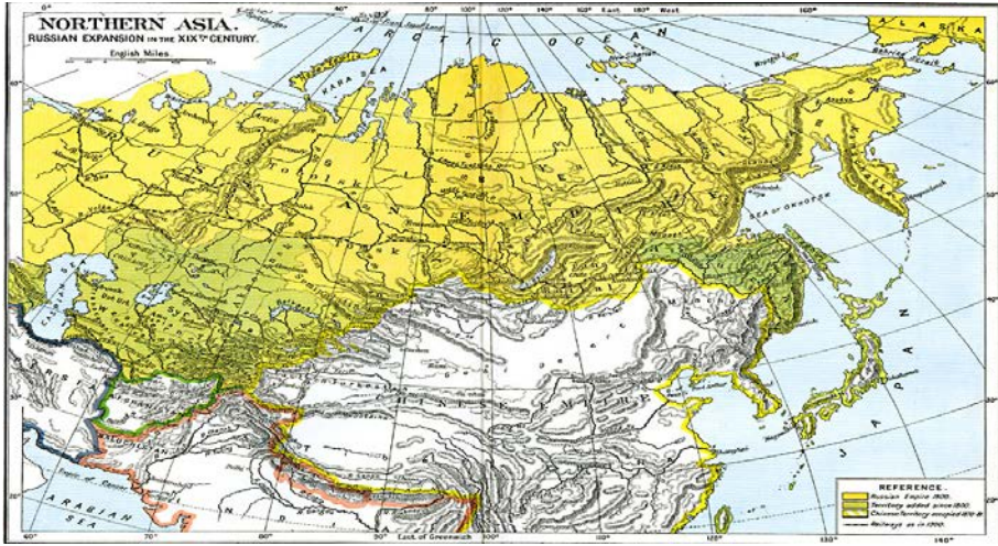
Harita II: XIX. yüzyılda Rusya'nın Genişlemesi 20

Rus ve Çin imparatorluklarının dış politika ve emperyal yayılım alanı genişlemelerinin yanı sıra ikili ilişkilerine bakıldığında özellikle XVII. yüzyıl sonrasında dikkat çeken gelişmeler karşımıza çıkmaktadır. V. S. Myasnikov, iki devlet arasında 1618 yılı itibari ile ilişkilerin kurulduğunu ifade etmektedir. Ona göre bu iki uygarlığın temas bölgesi haline gelen coğrafya ve