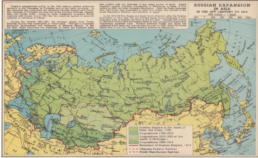
Harita I: 1800'lerden 1914'e Rus Yayılımı 4

Öte yandan XVIII. yüzyıl itibari İngiltere en önemli sömürgesi olan Hindistan diğer uluslararası aktörlere karşı koruma ve denetim altında tutma ihtiyacı daha da artmaya başlamıştır. Bunun önemli nedenlerinden biri 1790 yılı itibari ile Hindistan'ın, Britanya hazinesi için yılda 500.000 Sterlin gelir sağlamasıdır. Bu açıdan Hindistan'daki İngiliz yayılması vergi tabanını ülkedeki bu genişletme üzerine kurmuş ve kraliyetin hazine gelirini arttırmaya yönelmiştir. Böylece İngilizlerin ülkedeki kontrolü her geçen yıl daha da artmıştır. 1818 yılı itibari ile İngilizler Hindistan'ın büyük bir bölümünü doğrudan kontrol etmeye başlamıştır ev bu yapının bir diğer ayağı da denetim olmuştur. Nitekim İngilizler, Hint yönetiminin ikili ilişkilerde dahi yalnız hareket etmesini değil İngiliz danışmanları ile bir arada