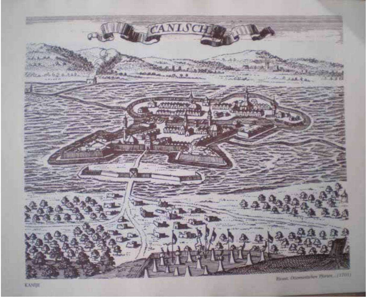
Ek 2: Kanije Kalesi ve Çevresini Gösteren Bir Gravür 127