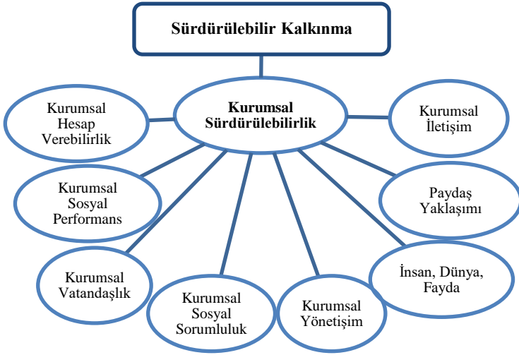
Şekil 2. Kurumsal Sürdürülebilirlik ve Diğer İlgili Kavramlar (Signitzer ve Prexl, 2008, s. 4)

“kurumsal hesap verebilirlik, kurumsal sosyal performans, kurumsal vatandaşlık, kurumsal sosyal sorumluluk, kurumsal yönetim, paydaş yaklaşımı ve kurumsal iletişim” kavramlarını kapsayan şemsiye terim olarak kullanmayı önermiştir. Kurumların vizyonlarını derinleştiren, buna bağlı olarak kurumsal varlıklarının devamı açısından kazanımlar sağlayan ve kurumu parçası olduğu toplumla bütünleştiren bu yapı Şekil 2’de gösterilmiştir.