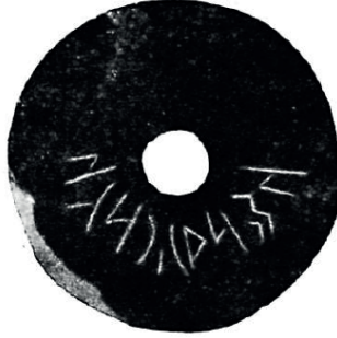
Resim 8: Olhon-Aymak'da keşfedilmiş Runik yazılı ağırşak (Ye. R. Rıgdılın, "K Drevnetyurkskim Runam Pribaykalya", Epigrafika Vostoka , VIII, M-L, 1953, 87)