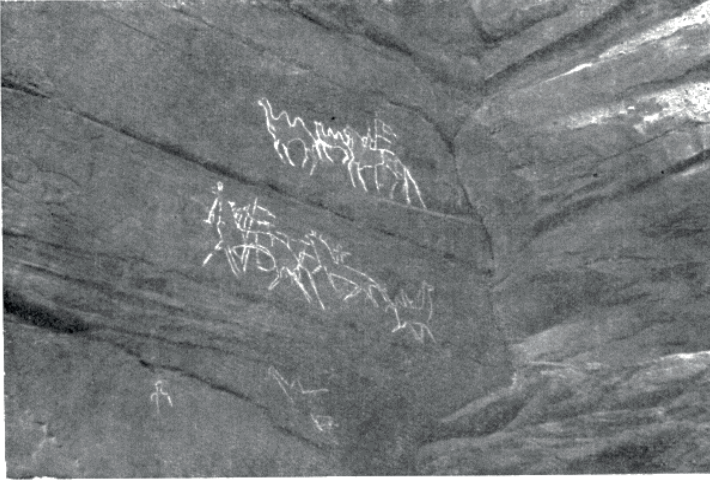
Resim 3: Kurıkan Atlı Süvarileri. (Okladnikov-Zaporejagaya, Lenskiye Pisanitsı, Naskalniye Risunki u Derevin Şişkino, 51).