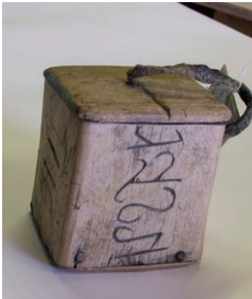
Resim 9: Tanımlanamamış XIII-XIX yy. arasına tarihlendirilmiş Suntar Ulus'tan enfiye kutusu üzerindeki Runik benzeri işaretler. (Levin, "Lensko-Pribaykalskiye Runiçeskiye Nadpisi", 21).