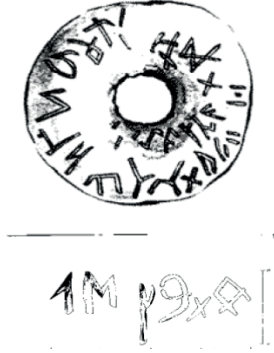
Resim 7: VII-X arasına tarihlendirilen Lena-Baykal bölgesinden ağırşak üzerine Runik yazı. (Levin, "Lensko-Pribaykalskiye Runiçeskiye Nadpisi", 23.).