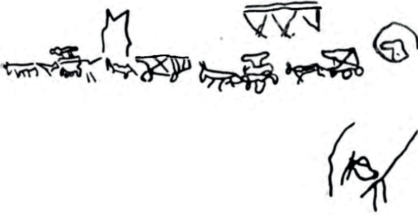
Resim 4: Kurıkanların Şişkin kaya resimlerinden göç sahnesi. (Okladnikov, İstoriyyi i Kulturi Buryatii , 216).