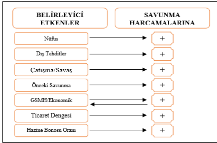
Şekil1. Savunma Harcamalarının Belirleyicileri ve Teorik Beklentiler