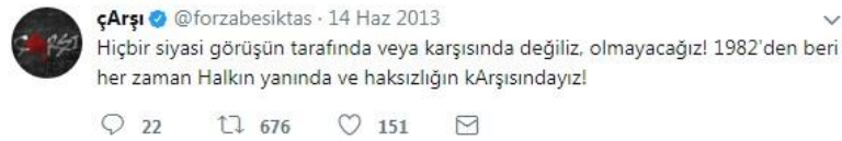
Şekil 15. Çarşı Taraftar Grubunun Siyasal İçerik Kategorisinde Paylaşmış Olduğu Twit Örneği-3

Şekil 14'te Çarşı'nın bir başka siyasal içerikli twitiyle dolaylı olarak hükümeti eleştirdiği görülmektedir. İkinci dünya savaşı sırasında müttefik güçlerin (ABD, İngiltere vs.) Hitler Faşizmini yıkmak için 6 Haziran 1944 yılında Normandiya Çıkarması adıyla anılan ve D-Day (Deliverance-Day: Kurtuluş Günü) olarak da bilinen askeri harekâtını hatırlatan Çarşı, harekâta yaşamını yitirenleri anarak Faşizmin karşısında yer aldığını ve özgürlükleri savunduğunu vurgulamıştır. Çarşı'nın bu paylaşımı Gezi Parkı eylemlerinin devam ettiği sırada yapmış olması, doğrudan olmasa da dolaylı olarak mevcut yönetimin faşist bir anlayışa sahip olduğunu ve özgürlüklerin kısıtlandığını vurgular niteliktedir. Buna göre Çarşı, Şekil 47'de her ne kadar bir siyasi görüşün yanında veya karşısında yer almadığını söylese de dolaylı olarak eleştirdiği mevcut hükümetin karşısında olduğunu göstermektedir. Bu açıdan Çarşı'nın Gezi Parkı eylemleriyle ilgili paylaşmış olduğu twitlerde doğrudan olmasa da dolaylı olarak siyasal bir söylemi benimsediği görülmektedir.