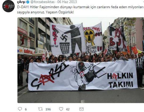
Şekil 14. Çarşı Taraftar Grubunun Siyasal İçerik Kategorisinde Paylaşmış Olduğu Twit Örneği-2

mümkündür. Buna göre Çarşı, Gezi Parkı eylemlerinde hükümetin takındığı tavrı paylaşmış olduğu ilk twitle eleştirdiği ve hükümetin bu tavrının yanlış olduğunu düşünerek karşı bir duruş sergilediği görülmektedir.