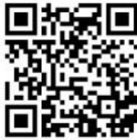
Şekil 4. Gezi Parkı Eylemleri Sırasında Geliştirilen Sık Bakalım! Marşı

Şekil 3’te yer alan videoda, Çarşı taraftar grubunun Gezi Parkı eylemleri için oluşturduğu bestelere bir yenisini eklediği görülmektedir. Yine biber gazı kullanımını eleştiren bu bestede, “ Sık bakalım! Sık bakalım! Biber gazı sık bakalım! Kaskını çıkar! Copunu bırak! Delikanlı kim bakalım! ” sözleriyle polise meydan okunduğu, dolaylı yoldan hükümetin eleştirildiği ve siyasal bir duruş sergilendiği görülmektedir. Çarşı’nın bu bestesi daha sonra amatör bir müzik grubu tarafından geliştirilerek marş haline dönüştürülmüş ve bu marş eylemlerin sembol şarkıları arasında yer almıştır (Şekil 4). Marşın sözlerinin o dönem Başbakan olan Recep Tayyip Erdoğan’ı hedef alarak hazırlandığı görülmektedir. Özellikle marşta geçen “ Yıkılacak Tayyip diktası! Sen gitmeden bitmez bu kavga! ” gibi sözler Recep Tayyip Erdoğan özelinde dönemin hükümetine bir karşı duruşu da sergilemektedir. Dolayısıyla Çarşı taraftar grubunun geliştirdiği “ Sık bakalım! ” bestesinin, Gezi Parkı eylemleri sırasında sosyal mobilizasyonu arttırmak ve diri tutmak noktasında bir araç olarak kullanıldığı ve doğrudan siyasal bir amaca hizmet ettiği de görülmektedir.