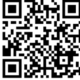
Şekil 2. Çarşı Taraftar Grubunun Biber gazı oleey! Bestesi

Şekil 2’de yer alan videoda görülebileceği üzere Çarşı, polislin yoğun biber gazı kullanımını “ Oooo biber gazı oleey! Biber gazı oleey! Biber gazı oleey! Biber gazı oleey! ” bestesiyle eleştirmiş ve polise meydan okumuştur.