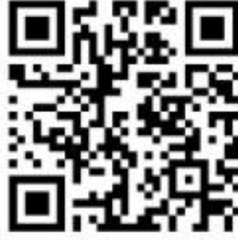
Şekil 3. Çarşı Taraftar Grubunun Sık Bakalım Bestesi

Şekil 2’de yer alan videoda görülebileceği üzere Çarşı, polislin yoğun biber gazı kullanımını “ Oooo biber gazı oleey! Biber gazı oleey! Biber gazı oleey! Biber gazı oleey! ” bestesiyle eleştirmiş ve polise meydan okumuştur.