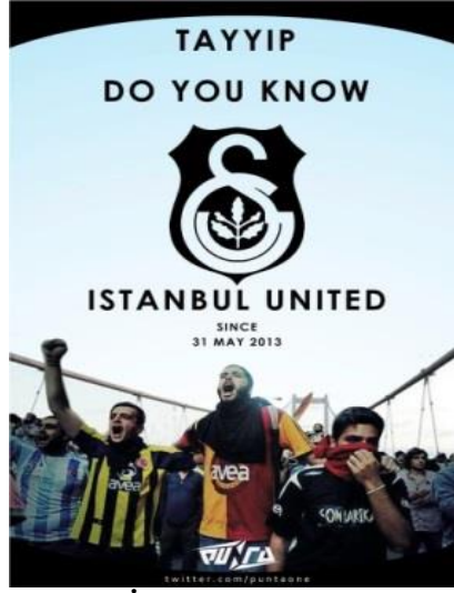
Şekil 7. İstanbul United Görseli

Söz konusu bu görsel, üç büyük kulübün amblemini tek bir ambleme dönüştürmüş ve taraftarlarını da yan yana sığdırmıştır. Gezi Parkı eylemlerine direnç katmak ve taraftar gruplarının birleşimini sağlamak için hazırlandığı anlaşılan bu görselde “ Tayyip Do You Know Istanbul United ” (Recep Tayyip Erdoğan’ı muhatap alan “ Tayyip İstanbul Birliği’ni Biliyor Musun? ”) ifadeleri yer almaktadır. Bu yönüyle, görselin taraftar gruplarının birleşimini sağlamanın yanı sıra siyasal bir amaca hizmet ettiği de görülmektedir. Gezi Parkı eylemlerinin kitlesel bir özellik kazanarak tüm Türkiye’ye yayılması, İstanbul kulüplerinin yanı sıra Anadolu kulüplerinin de eylemlere destek vermesinin önünü açmıştır. Başta Trabzonspor olmak üzere, Bursaspor, Eskişehirspor, Göztepe, Karşıyaka gibi birçok Anadolu kulübü de gezi parkı eylemlerine hem gerçek zamanlı hem de dijital katılım sağlayarak desteklerini göstermişlerdir. Trabzonspor’un en bilinen taraftar grubu Vira, eylemlerin başladığı ilk hafta hem dijital ortamda hem de kent meydanında (Şekil 8) desteğini göstermiş, ancak bu destek Trabzonspor kulübünün yapmış olduğu açıklama sonrasında son bulmuştur.