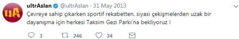
Şekil 16. ultrAslan Taraftar Grubunun Siyasal İçerik Kategorisinde Paylaşmış Olduğu Twit Örneği

Şekil 15'te Çarşı, hiçbir siyasi görüşü benimsemediğini vurgulayarak, kurulduğu ilk yıldan itibaren haksızlıklara karşı olduğunu dile getirmektedir. Bu twitle Çarşı, örgütlü bir yapı olarak kendini siyaset üstü bir yere konumlandırmaktadır. Buna karşın Gezi Parkı eylemlerinin başladığı ilk günlerde paylaşmış olduğu bir başka twitle Çarşı, her ne kadar siyasi bir görüşün karşısında veya yanında yer almadığını vurgulasa da ideolojik bir duruş sergileyerek Gezi Parkı eylemlerine destek verdiğini göstermektedir.