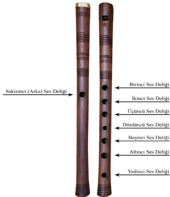
Şekil 1: Yaşar Güç Yapımı Dilli Kavalmın Ses Delikleri

Anadolu’nun pek çok yerinde farklı ölçülerde görülen Dilli Kavalm yapısal özellikleri çalgıyı yapan ustaya ve çalgının tonuna göre de değişkenlik göstermektedir. Çalgıların boyutları büyüdükçe ses tonları kalınlaşır, çalgı boyutları küçüldükçe de ses tonları tizleşir. Dilli kavalm önde yedi arkada bir delik olmak üzere sekiz ses deliği bulunmaktadır. Çalgının en önemli özelliklerinden birisi de dil kısmının oluşudur. Dilli kavallar genel olarak kromatik perde dizilişine göre açılırlar. Üzerlerinde koma seslerin çıkabileceği bir aparat bulunmaz. Yalnız, Türk müziği ses sisteminde koma değerler bulunduğundan bu çalgı üzerinde komaların duyurulması üç yolla mümkün olabilmektedir. Birinci yol; bu çalgıyı çalan kişinin nefesini kontrol ederek çalma esnasında koma sesleri üfleme şiddetine göre ayarlaması, ikinci yol; çalgıyı yapan ustaların bu perdeleri olması gereken yerden aşağı ya da yukarı kaydırarak koma değerlerini ayarlaması, üçüncü yol ise; perdelerin üzerlerine koma değerine denk gelecek şekilde bant ya da türevi yapııştırarak perdenin çapını koma değerine göre ayarlamaktır. Literatürde yer alan ve bizzat ulaşılan bazı dilli kavalların ölçüleri aşağıdaki tablolarda ve görsellerde gösterilmiştir.