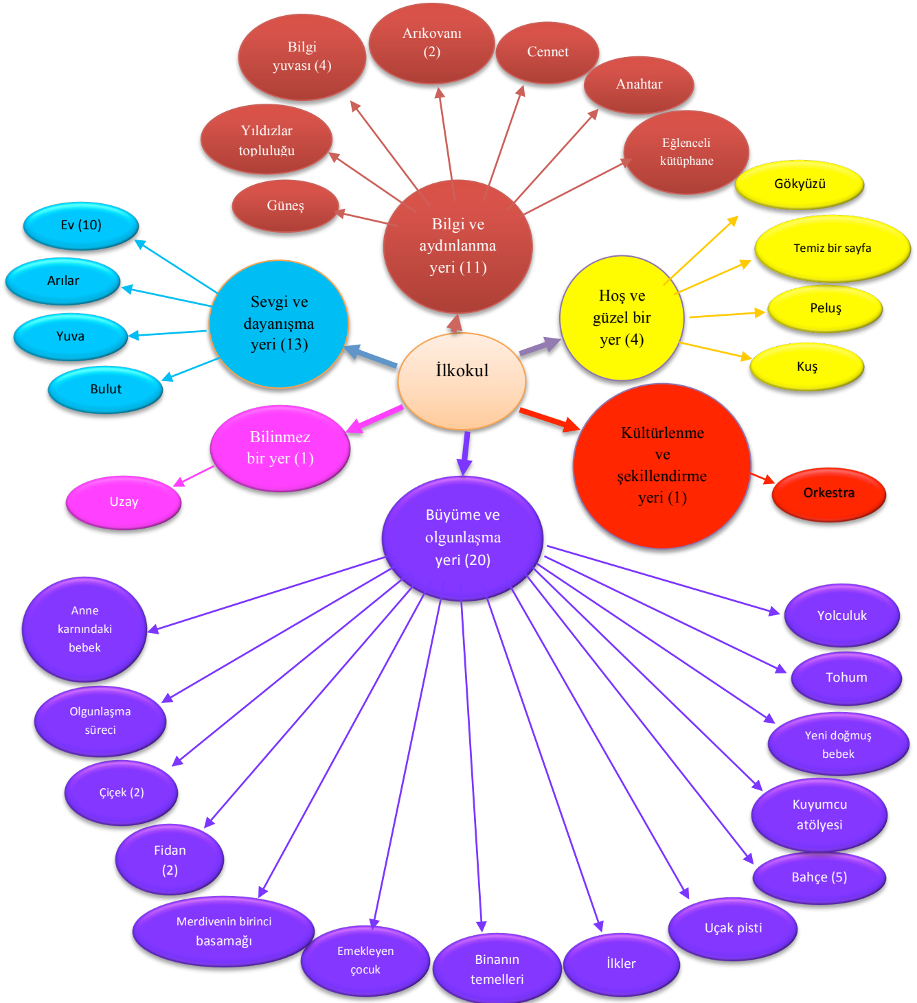
Şekil 1. İlkokul birinci sınıf öğrenci velilerinin ilkökul kavramına ilişkin oluşturdukları metaforlar

Şekil 1 incelendiğinde ilkökul birinci sınıfa yeni başlayan öğrenci velilerinin “ilkokul” kavramına ilişkin olarak geliştirdikleri metaforlardan oluşturulan kategoriler “büyüme ve olgunlaşma yeri (20)”, “sevgi ve dayanışma yeri (13)”, “bilgi ve aydınlanma yeri (11)”, “hoş