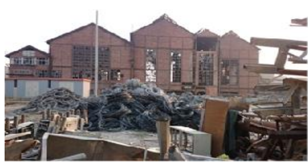
Foto 14- Eski Elektrik Fabrikası, (2018). Fotoğraf: L. İncedere .