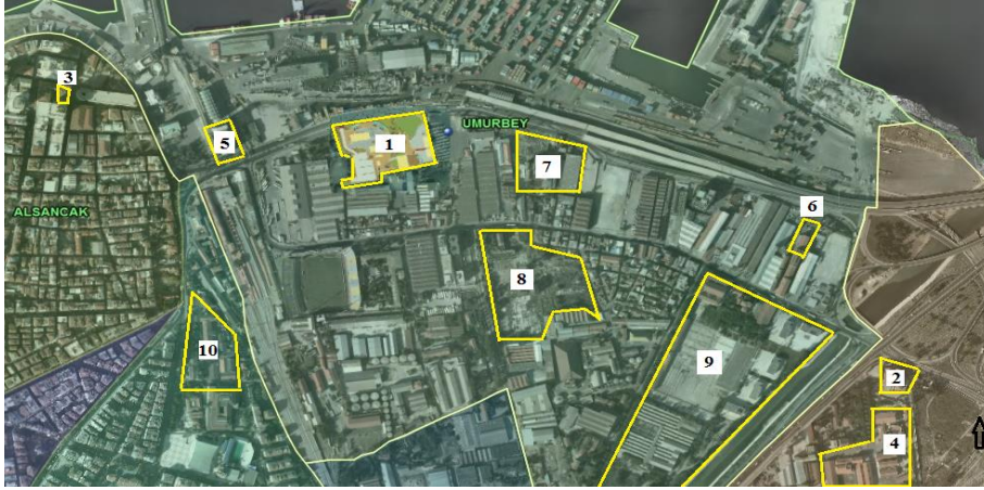
Şekil 3- Alsancak liman ardi bölgesinde yer alan endüstri mirası alan ve yapıları

renklendirme çalışmaları yapılmış ve bu yolla kentsel yapıya farklı bir doku kazandırılması amaçlanmıştır. Bununla birlikte, Sümerbank Basma Sanayi (Sümerbank Baskılı Kumaş Sanayi), Şark Sanayi (Oriental Industry), TEKEL Sigara Fabrikası, Elektrik Fabrikası ve Eski Su Depoları farklı projelerde gündemde yer alsalar da halen atıl durumdadır.