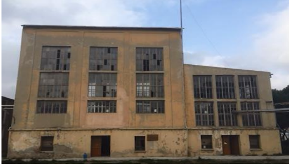
Foto 7- Mahall Bomonti Projesi öncesi Halkapınar Şarap ve İspirto Fabrikası (2017).