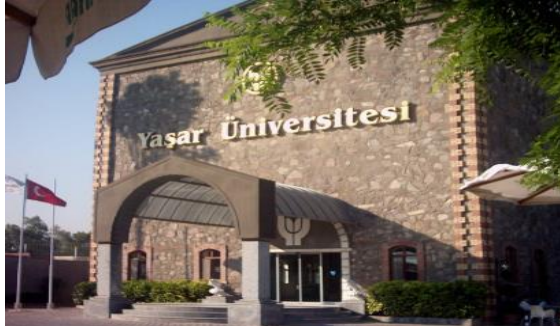
Foto 11- Eski un değirmeninin Yaşar Üniversitesi Alsancak Kampüsü olarak kullanımı, (2017).