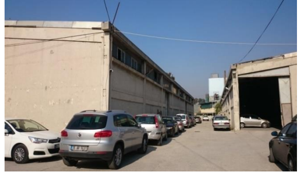
Foto 18- Eski Sümerbank Basma Sanayi, (2018).