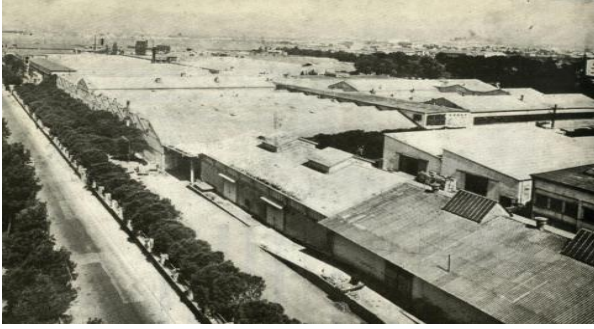
Foto 17- İzmir Sümerbank Basma Sanayi Müessesesi, (1950). Kaynak: Er, 2011.