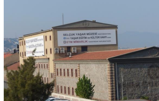
Foto 12- Eski un değirmeninin Selçuk Yaşar Müzesi restorasyonu, (2018).