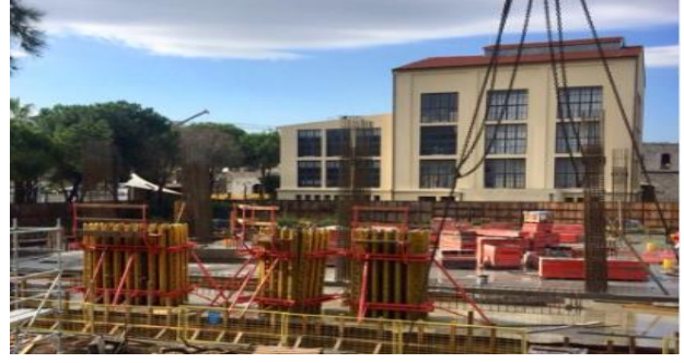
Foto 8- Mahall Bomonti Projesinin inşaat sürecinden bir görüntü (2018).