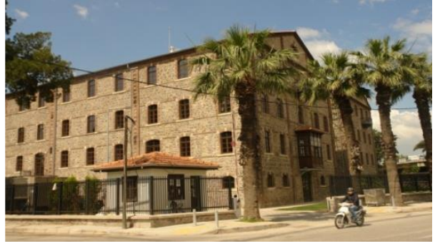
Foto 4- İzmir B.Ş.B. Meslek Fabrikası Binası, (2018).