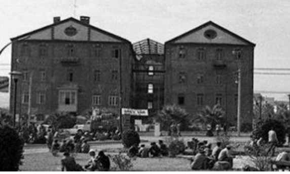
Foto 3- Eski Un Fabrikası, (1950).