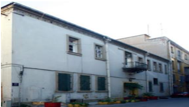
Foto 5- Eski Tekel Tütün Deposu