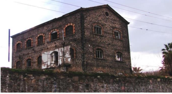
Foto 15- İzmir Şark Sanayi Müessesesi, (1960).