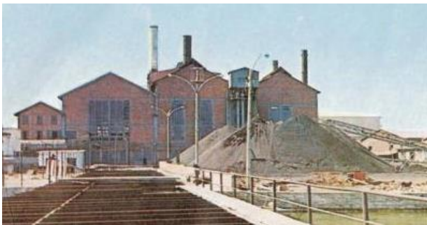
Foto 13- İzmir Elektrik Fabrikası, (1950'li Yıllar).