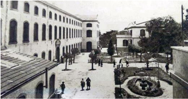
Foto 19- İzmir Tekel Tütün Fabrikası, (1950'li yıllar).