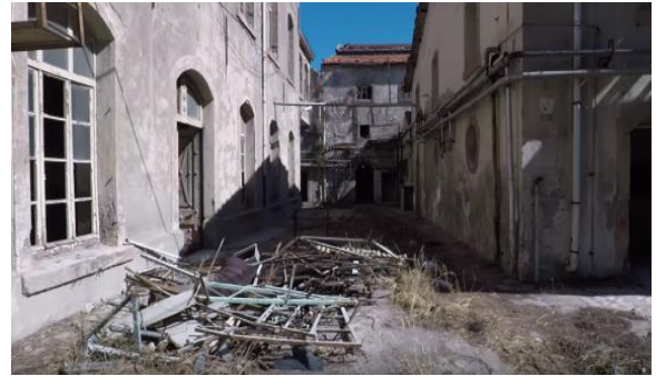
Foto 20- İzmir eski Tekel Tütün fabrikasının bugünkü görünümü, (2018).