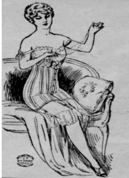
Resim 7: Kadınlar Dünyası’nda Yayınlanan Bir Korse Reklam Resmi

Bir kadın giysisi olarak tuvaletin dönemin kadınları arasında oldukça popüler olduğunu ifade etmiştik. Bu nedenle kadın dergi ve gazetelerinde reklamı en çok yapılan ürünlerden biri de tuvaletlerdir. Aynı şekilde dönemin kadınları arasında saç bakımı ve güzellik salonu “Hanımlara