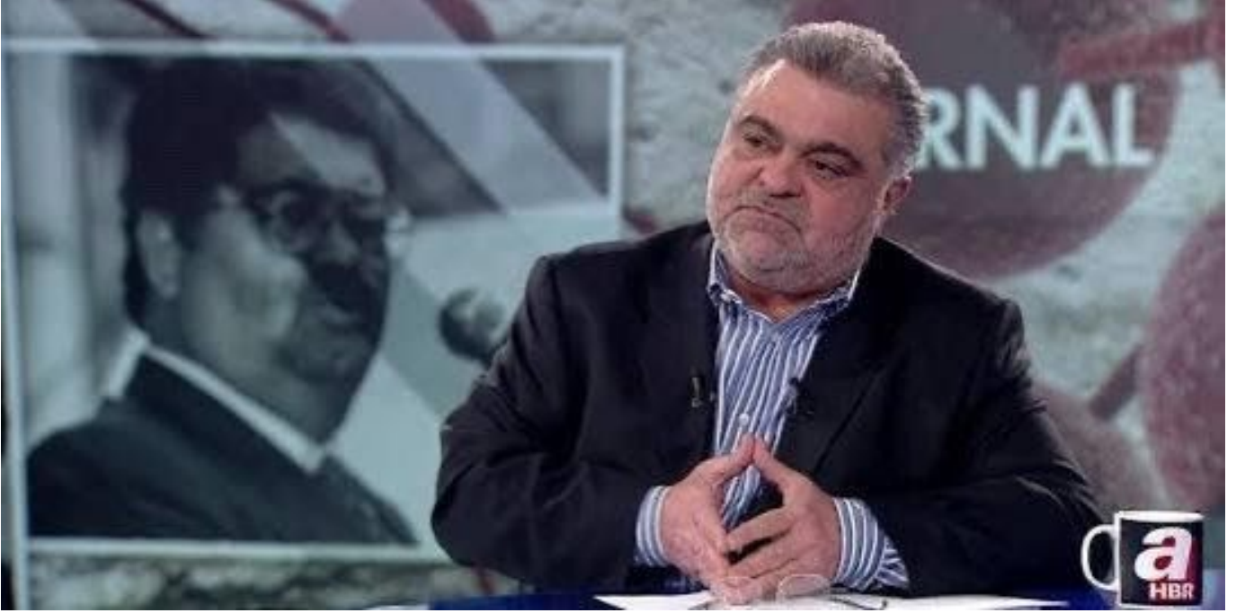
Görsel 10: Güncel olaylara bağlı olarak doldurulabilen “Babamı ..... Öldürdü” şablonu.