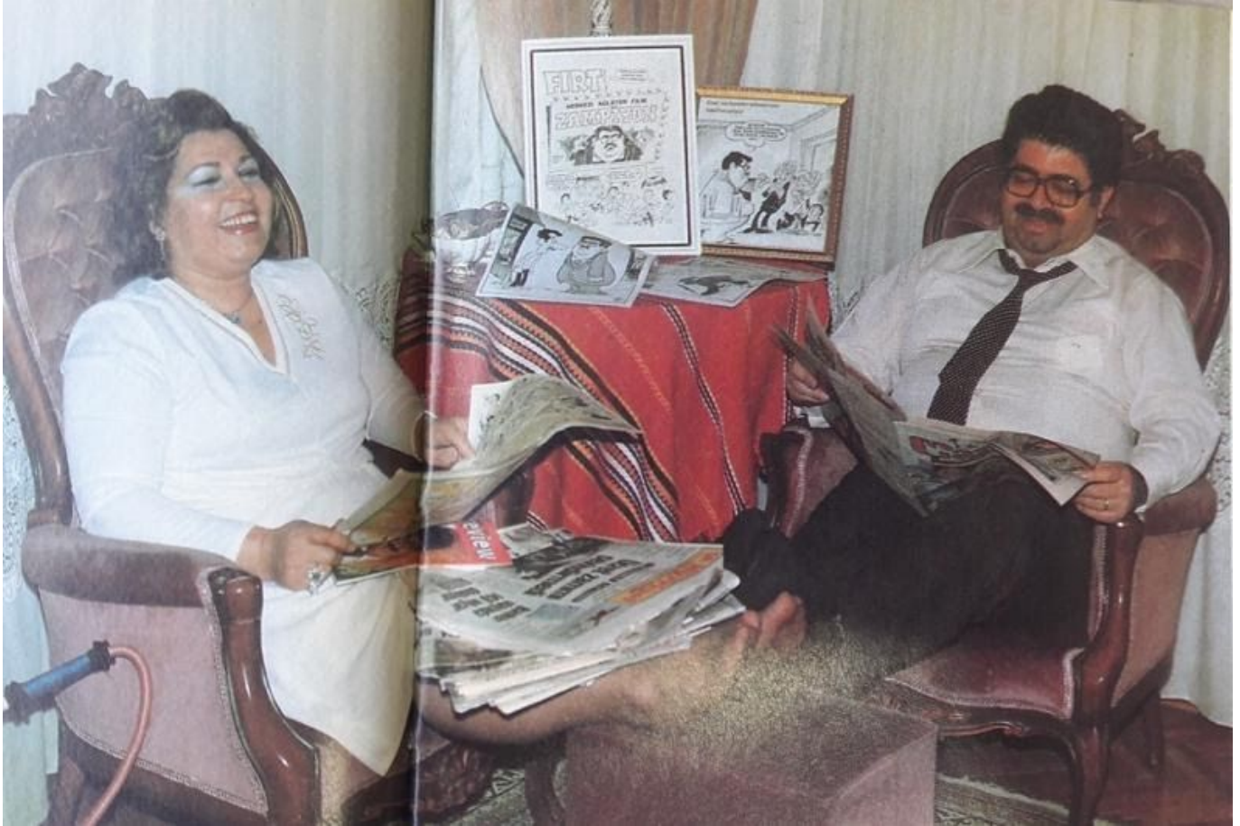
Görsel 2: Özal’ın çerzveleterek sakladığı karikatürler

Bu durumun güncel Türkiye koşullarında en sık karşılaşılan örneği siyasetçilerin eleştiriye ve mizaha açık olması gerektiğine dair tartışmalardır. 2005 yılında Musa Kart tarafından çizilen karikatüre açılan davadan beri, Özal’ın kamuoyunda olması gerekene dair örnek olarak anılması dikkat çeker. Özal’ın kendi hakkındaki çizilmiş karikatürleri takipten zevk aldığı ve hatta bazılarını çerzine imzalatıp çerzvelettiği sıkça bahsedilen bir konudur (bkz. Görsel 02) .