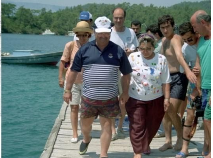
Görsel 1: Turgut Özal ve eşi Semra Özal

Özal'ın dikkat çekilen bu özellikleri, başlangıçta siyasal sistemin prosedür ve politika yapım süreçlerini tali hale getirirken, geçmişi daha ışıklı bulan nostaljik tavrı şekillendirir. Sonrasında da kendisini dönemin siyasetini bugüne nazaran olumlu bulunmasının gerekçelerine ekler. Keza nostaljik mukayese Özal döneminin renkliliği ile bugünün monotonluğundan ibaret kalmamaktadır. Özellikle Özal'a iktidarı döneminde eleştiriler yönelten birçok ismin "Yeni Türkiye"ye dönük eleştirilerinde bir referans model olarak ona dönmeleri, siyasetin nostaljisinin geniş sınırlarını gösterir. Örneğin Hasan Cemal (2013) Gezi Parkı eylemleri döneminde yaşanan polis şiddeti ve kutuplaşma konusunda "Özal olsaydı, Gezi Parkı'na gider, 90 kuşağının arasına karışırdı" yorumunu yapmaktadır. Bedri Bayram (2019) ise YSK kararıyla İstanbul Büyükşehir Belediyesi seçimlerinin iptal edilmesini "Turgut Özal'ın bile, sosyal demokratları ve Atatürkçüleri o kadar deli eden siyasi eylemi ve izi varken, böyle bir hukuka ve rejime güven kaybı yaşatmamıştı" sözleriyle yorumlar. Nostaljinin konusu olan sadece Özal'ın siyaset biçimi ya da kişiliği değil, aynı zamanda kadrolarıdır da. Bu manada Uğur Dündar (2020), Cumhurbaşkanı Erdoğan'ın çalışma çevresine dair