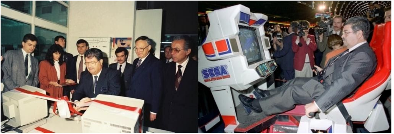
Görsel 9: Turgut Özal'ın teknolojiye düşkünlüğünün çeşitli örnekleri

özgünlüğü paylaşımların geneline bakıldığında rahatça gözlenebilir. 3 Ayrıca yaşadığı dönemde teknolojiye yoğun ilgisi (bkz. Görsel 10) bugün için caps ve meme'ler aracılığıyla yeniden üretilen mizahi bir içeriğe de etki etmiştir. 4 Özal Capsleri, İsmet Capsleri'yle birlikte (Dede vd., 2014) siyasetçilerin fotoğraflarından üretilen mizahın önemli örneklerindedir. 5 ANAP'ın ve Özal'ın günümüzün parodi hesaplarına konu olmaları ve troll hesaplar tarafından profil fotoğrafı olarak seçilmeleri, yine Özal'ın temsil biçimleriyle ilişkilendirilebilir. ANAP'a dair bir parodi hesabın "Sen oy vermediysen baban verdi ya da deden, bizi inkar edemezsiniz" şeklindeki paylaşımı (Twitter, 2013), ayrıca sosyal medyadaki takipçi profiliyle ANAP arasındaki ilişkinin ancak nostaljik bir muhteva taşıyacağı varsayımını da örnekler. Ve son olarak Ahmet Özal'ın "babamı...öldürdü" temalı görseli (bkz. Görsel 9) genç kuşaklar ile Özal ailesi arasında bir köprü işlevi görmekte ve "bugünkü gençlerin Özal ailesini tanınmasına" vesile olmaktadır (Kozanoğlu, 2018, s. 120).