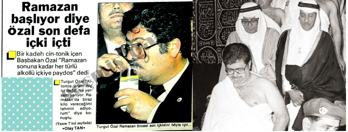
Görsel 5: Özal'ın Ramazan hazırlıkları

Türkiye'nin eski rejiminden yenisine geçişteki travmatik dönüşümler arasında sekülerizm ön sıralarda gelir. Dinin ekonomik, siyasal, toplumsal, eğitsel ve ailevi tüm alanlardaki artan ve yaygın gözlenen etkisi, sekülerizmin yitimini kritik hale getirir. Bu kayba dair nostaljinin düşünsel ve tarihsel referanslarında, kuşkusuz Atatürk ve tek partili dönem önemli yer tutar. Ancak sekülerizmin tıpkı Ostalgie ve Yugo-nostalgie'da olduğu üzere boş-gösterenler üzerinden tartışılmasında karşımıza çıkan Özal olur.