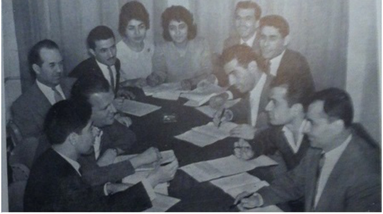
Şekil 1: Bir Vak'a Tartışması

“case”ler sunabiliyorlardı. Derslerde talebeler, konuşan arkadaşlarına dönebilerek rahat dinleyebilsinler diye dersaneler yardım daire şeklinde, amfi idi. Oturdıkları sandalyeler, eksenini etrafında, sağa, sola dönebiliyordu. Nitekim, biz de İşletme İktisadı Enstitüsü'ne tahsis edilen kısımdaki dershanemizi o şekilde yaptırıldı.”