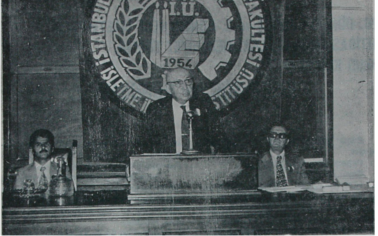
Şekil 3: Vehbi Koç’un 20.Dönem Gündüz ve 2. Dönem Gece İşletmecilik İhtisas Programları Mezuniyet Töreni Konuşması

Vehbi Koç gibi isimler enstitü mezuniyet törenlerine de katılmışlardır. Örneğin, Vehbi Koç 1977 yılında enstitünün 20. Dönem gündüz ve 2. Dönem gece İşletmecilik İhtisas Programları mezuniyet töreni onur konuğu olarak bir konuşma yapmış ve “üniversite ile iş dünyası arasında işbirliği kurmanın, pratik ve nazari bilgilerin birleştirilmesinin” öneminden bahsetmiştir (Koç, 1977, s.1). Bu bağlamda, o dönem için İşletme İktisadi Enstitüsü’nün, özellikle Türkiye gibi işletmecilik okullarının iş hayatıyla sınırlı ilişkilere sahip olduğu bir ülkede önemli bir istisna teşkil ettiği belirtilmektedir (Özalp, 1972).