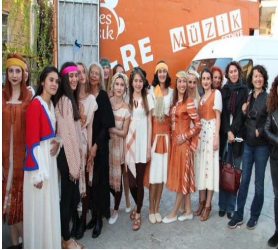
Foto 9: Yeşilüzümlü ve Bölgesi Kuzugöbeği ve Dastar Festivali (El Dokuma Dastar Giysileri Gösterisi)