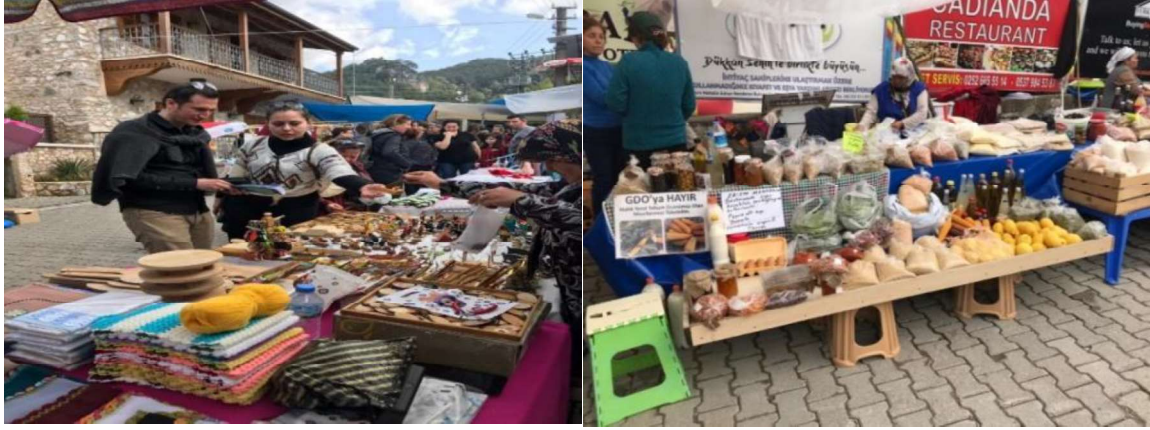
Foto 1-2: Yöreye Özgü Ahşap Hediyeliklerin ve Yöresel ve Doğal Ürünlerin Satıldığı Tezgâhlardan Görünüm