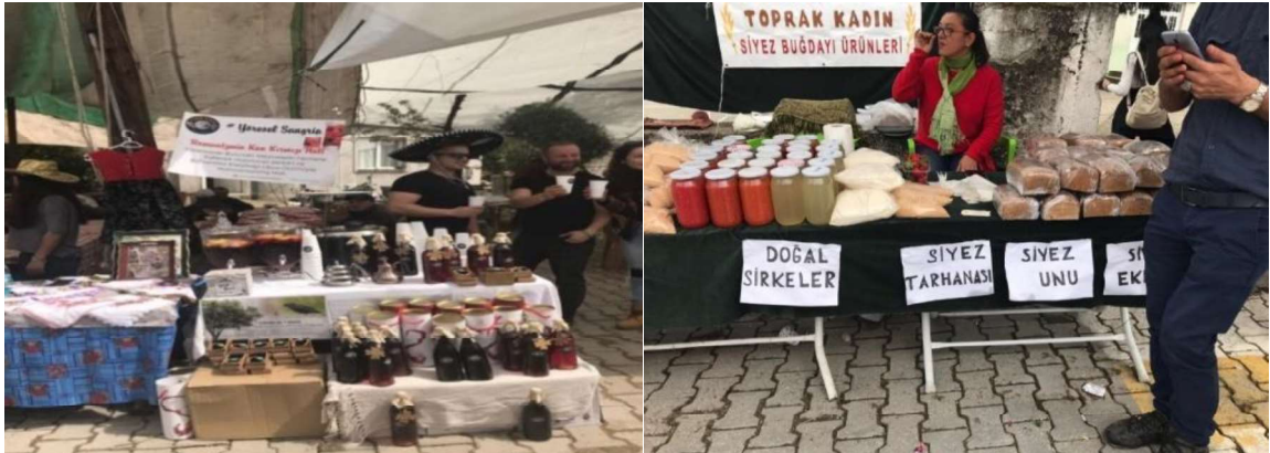
Foto 3-4: Yöresel Likya Şaraplarından Sangria ve Doğal ve Yerel Ürünler