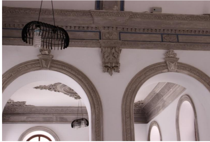
Resim 14. İzmir Menemen Agios Konstantinos Kilisesi Kuzey Oda

Kuzey odanın tavanında ise yüksek kabartma tekniğiyle oluşturulmuş büyük bir motif yer alır. Bezemenin merkezinde beş şeritli bir dairenin içine yerleştirilmiş akantus yaprakları bulunur. Bu dairenin dört tarafında yüksek kabartmayla oluşturulmuş bitkisel motifler yer alır. Burada kullanılan akantus yaprakları frizlerde bulunan akantus motiflerini andırmaktadır. Silmelerin birleştiği köşelerde üçgen formla sığdırılmış kıvrık akantus yaprakları yer almaktadır. Dört köşedeki motifler de yüksek kabartma tekniğinde ve birbirine benzerdir. Odaya girildiğinde tüm odayı tavan hizasından dolanan bir