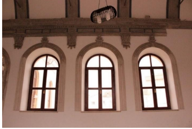
Resim 20. İzmir Menemen Agios Konstantinos Kilisesi Naos Güney Duvarı