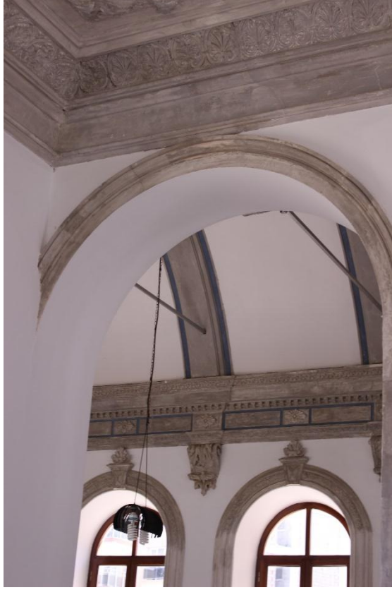
Resim 7. İzmir Menemen Agios Konstantinos Kilisesi Kuzey Yan Mekân

Naosun kuzeyinde ve güneyinde bulunan ibadet mekânlarının üst örtüleri dışta üç yöne eğilimlidir ve içte yine ahşap tavan örtü bulunmaktadır.