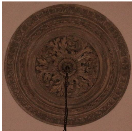
Resim 23. İzmir Menemen Agios Konstantinos Kilisesi Üst Örtüde Bulunan Batı'dan Üçüncü Pano

Dięer panolardan oldukça farklı olan dördüncü panonun merkezinde yirmi dört adet řeridin oluřturduęu yuvarlaęın ortasında bir güvercin kabartması bulunur. Burada güvercin figürünün yer