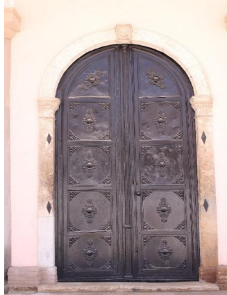
Resim 11. İzmir Menemen Agios Konstantinos Kilisesi Ana Giriş Kapısı Detay