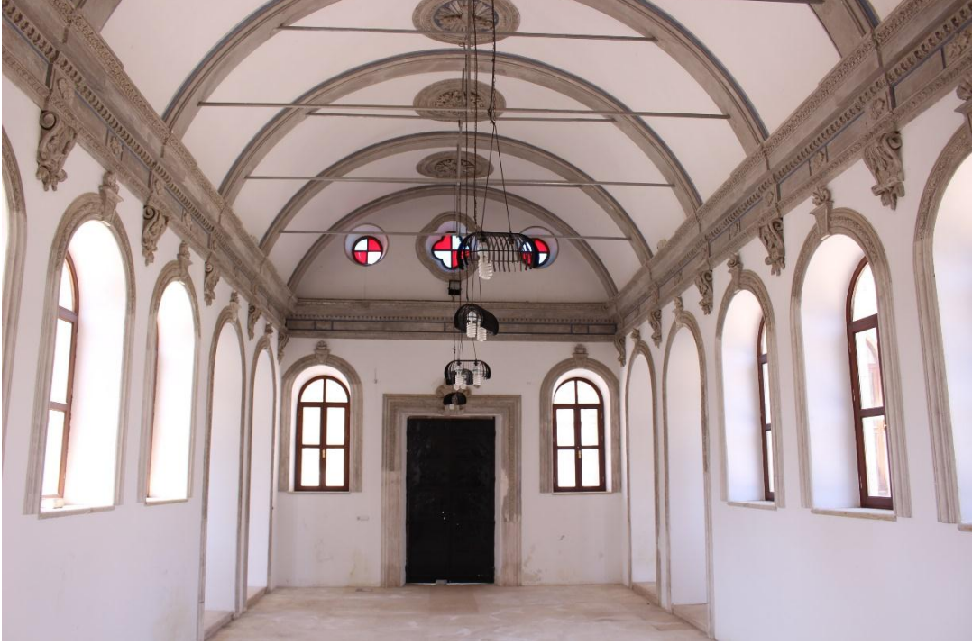
Resim 4. İzmir Menemen Agios Konstantinos Kilisesi Naos ve Üst Örtüsü