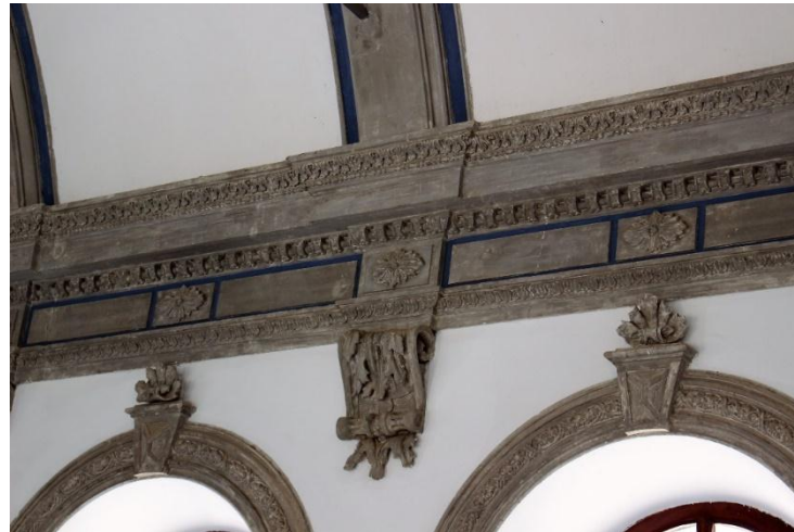
Resim 22. İzmir Menemen Agios Konstantinos Kilisesi Naos Kuzey Duvarı

İkiz kemer ve pencere açıklıkları bu volütlü bitkisel bezemelerin arasına yerleştirilmiştir. Tüm bu bezemeler doğudaki pencerelerin bitiminde sonlanmıştır. Dolayısıyla altıncı kemerin bittiği yer sadece dışa taşırılmış sütun/paye başlığı şeklinde düzenlenmiştir. Buradan sonra üstten üç sıra silme apsisin olduğu duvara kadar devam eder. Apsis duvarında silme yoktur. Kuzey ve güney cepheler plan açısından simetrik olduğu gibi süsleme bakımından da simetriktir.