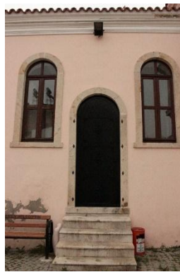
Resim 12. İzmir Menemen Agios Konstantinos Kilisesi Kuzey Yan Giriş Kapısı

Pencere söveleri oldukça sadedir. Üzerlerinde herhangi bir süslemeye rastlanmaz. Saçak hizasını dolaşan iki sıra silme yapıya hareket sağlamıştır (Resim 2). Dıştaki bu sade görünüm, yapının içinde yerini yoğun süsleme programına bırakır.