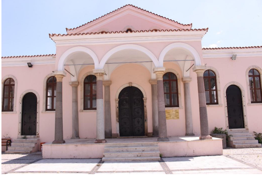
Resim 3. İzmir Menemen Agios Konstantinos Kilisesi Ana Giriş Kapısı