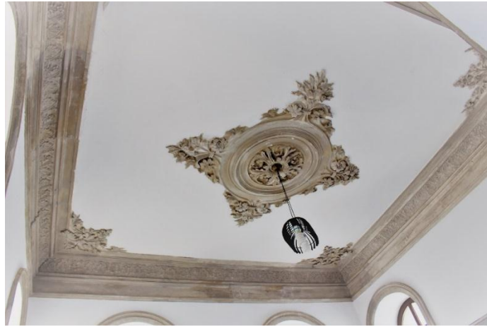
Resim 16. İzmir Menemen Agios Konstantinos Kilisesi Kuzey Mekân Süsleme Detay