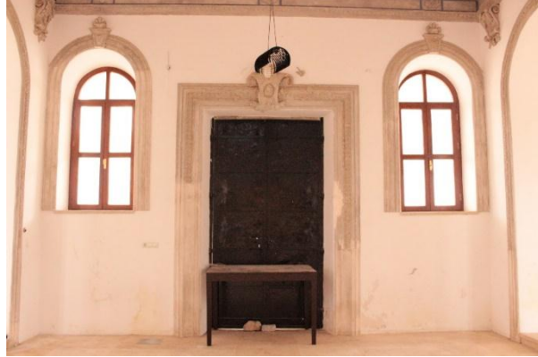
Resim 18. İzmir Menemen Agios Konstantinos Kilisesi Ana Giriş Kapısı Detay