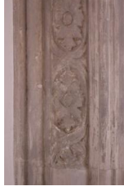
Resim 13. İzmir Menemen Agios Konstantinos Kilisesi

Her iki kemerin kilit taşını yukarıdan aşağıya doğru daralan düzgün dikdörtgen motif oluşturmuştur. Bu geometrik motifin ortasında merkeze doğru çıkıntı yapan üçgen ve dörtgenlerden oluşan geometrik şekiller yer alır. Tüm bu düzenlemenin üstünde yanlardan çıkıntı yapmış birer kaide bulunur ve bu kaidelerin üstünde de birer akantus motifi yerleştirilmiştir. Akantus motifleri yüksek kabartma tekniği, kemerlerdeki çiçek motifleri alçak kabartma tekniği ile oluşturulmuştur (Resim 14).