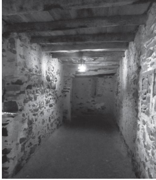
Şekil 3. Gorée adası köle evi, kölelerin tutulduğu hücre (Hinchman, 2015, s. 246).

Washington Post muhabirinin sözlerine ek olarak, Hinchman tarafından Gorée adası ziyareti sırasında fotoğraflanan bu hücre resmi ise ihraç kölelerinin yolculuğa çıkmadan önceki şartlarını gözler önüne sermektedir.