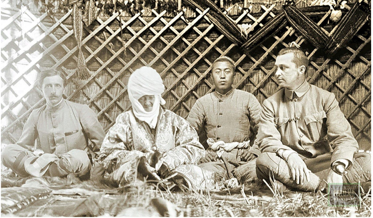
Курманжан Датка и Карл Густав Маннергейм, июнь-июль 1906 года. (Kurmancan Datka ve Karl Gustav Mannergeym, 1906 yılının Haziran- Temmuz ayları)