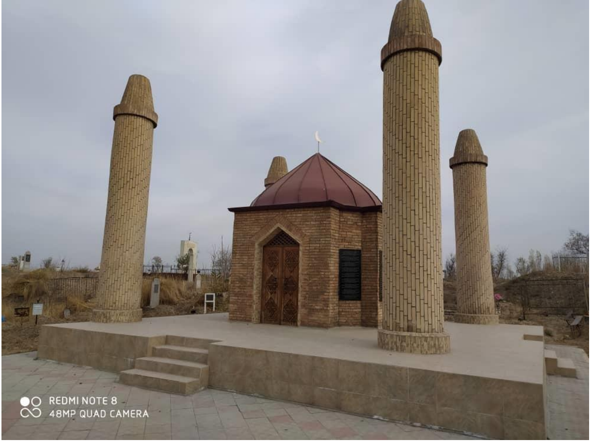
Sermazar Kabristânı'nda Salâhuddîn Hazreleri'nin (k.s) kabri civârında bulunan Kurmancan Datka'nın türbesi. OŞ/ KIRGIZİSTAN