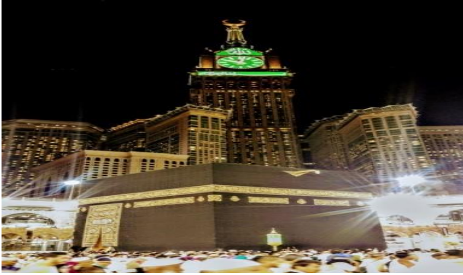
Fotoğraf 3: Ecyad Kalesi'nin yerine Kabe'nin başına dikilen timsallerin en büyüğü: Zenzem Tower

kazınması faaliyetiydi. Zira kısa sürede yerine ikame edilen Amerikan Batı mimarîsi ve kültüründen başkası değildi. Bedeviliğe yaslanan Vehhâbiliğe göre İslâm kültürüne ait ne kadar unsur varsa bid'at ve şirk alametiydi ve ortadan kaldırılmalıydı. Bu itikatla Mekke ve Medine Osmanlı/İslâm eserlerinden temizlenmiştir. Osmanlı'dan kalan son eserlerden biri olan Ecyad kalesinin yerine dikilen Zenzem Tower, tam da Suudî-Vehhâbî anlayışının sembolü gibidir. Osmanlı/Türk mimarîsinin yerine Kâbe'nin hemen yanı başına Ecyad kalesinin yerine 601 m. yüksekliğinde tamamen Batı tarzı ve İslâm dışı bir takım semboller içeren bir gökdelen dikiliyor. Adını Zenzem koyup, tepesine kelime-i tevhîdi yazınca, kapitalizmin abidesi olan yapı hemen ihtida edip şirk ve bid'attan arınıyor ve "muvaahhid" oluveriyordu!