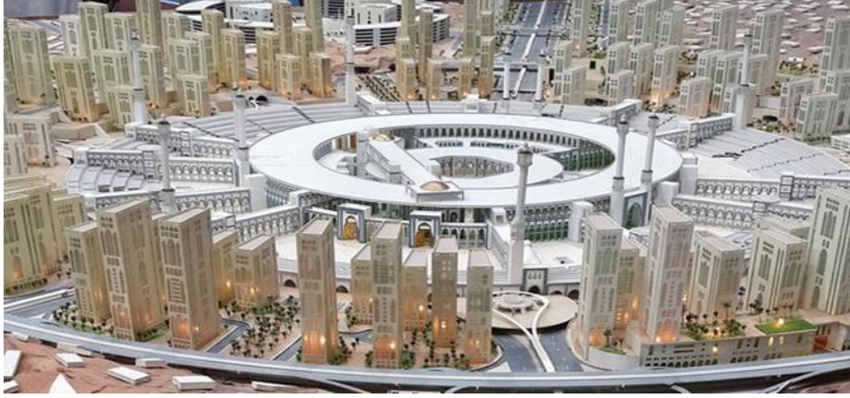
Fotoğraf 4. Suudi Arabistan’ın 2035 yılına kadar gerçekleştirmek maksadıyla hazırladığı Mekke Projesi 83