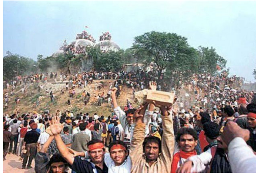
Şekil 4 Babri Mescidi ve Eylemciler 36 .

Hinduların gelenek ve inanışlarına göre Büyük tanrılarında biri olan Vishnu, Kral Rama'da reenkarne olmuştur. Kral Rama'nın doğduğu yerde Hindu tapınağı Ramjanmabhumi kurulmuştur. Ramjanmabhumi arkeolojik kazıları yönetimler tarafından desteklenmiş, yapıya dair izler aranmıştır. 1992 yılına gelindiğinde Hindistan'ın Ayodhya Bölgesi'nde on altıncı yüzyılda yaptırılan Babri Mescidi (Şekil 4), Hindu fundamentalistler tarafından Ramjanmabhumi üzerine kurulduğu gerekçesiyle yıkılmıştır 35 . Caminin yıkılması ve yerine Hint tapınağının yapılmasının planlanmasıyla politize olmuş yerel hafıza çok katmanlı tarihsel geçmişin önüne geçmiştir.