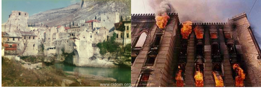
Şekil 3: Stari Most 1995 33 , Vijećnica/Ulusal Kütüphane yanarken 1992 34 .

Eski Yugoslavya topraklarında yaşanan kanlı çatışmalar sırasında dini ve etnik kimlik tanımlayıcı unsur haline gelmiştir. Coğrafi bir alan üzerinde hak iddia eden taraflar kimliği tanımlayan anıtsal yapıları, dini yapıları, konutları, kütüphane ve arşivleri sistematik olarak hedef almıştır. Mostar/Stari Most Köprüsü (Şekil 3), Saraybosna/Vijećnica Binası (Şekil 3) gibi sembolik yıkımların yanında Foča, Stolac gibi çok sayıda yerleşimde sistematik süpürme harekâtları bu gerekçelerle yapılmıştır. Aynı mücadeleler bugün kent planlama ve kültür varlıklarına yönelik eylemlerle sürdürülmektedir.