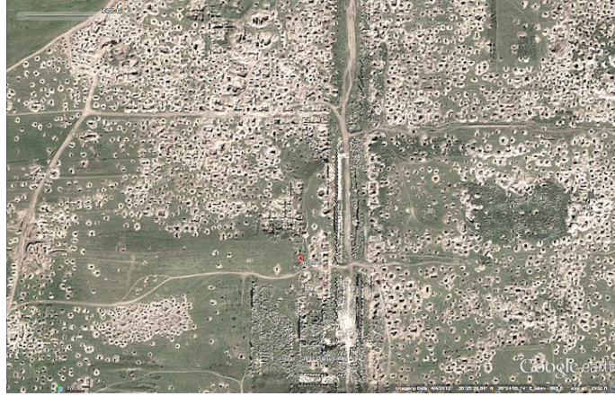
Şekil 6 Apamea antik kentinde yasa dışı kazılar 58 .

Çatışmalı bölgelerde devletler eğitim, sağlık, güvenlik, ekonomi, toplumsal yaşam, sosyo-kültürel hayat gibi alanlarda yönetme ve sürdürme kabiliyetini yitirebilmektedir. Şiddet ortamının yaygınlaşması sosyo-ekonomik düzenin bozulmasına, işsizlik ve suç oranlarının artmasına neden olmaktadır. Sosyo-ekonomik düzenin bozulması ve kültür mirasının yağmalanması arasında geri besleme döngüsü oluşmaktadır (Şekil 7). Örneğin; 1967’den itibaren İsrail’deki ekonomik ortama bağımlı hale gelen Filistinlilerin 1987’de 1’inci İntifada’nın başlamasıyla İsrail’deki iş ortamına erişimi kısıtlanmıştır. Ekonomik darboğaz nedeniyle mülk sahipleri, yerel halk ve profesyonel kaçakçılar arasında gelirin paylaşıldığı yasadışı kazılar ve yağmalar başlamıştır.