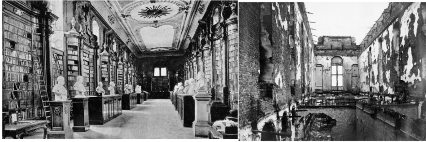
Şekil 2 Louvain Kütüphanesi, Büyük Salon 31 .

I. Dünya Savaşı'nda topyekûn galibiyete ulaşmak veya topyekûn mağlubiyetten kaçmak için bütün imkânları kullanarak topyekûn savaşmak kaçınılmaz görülmüştür. Alman militarist ulusalcılığı için anti-katolisizm güçlü bir unsur olmuş ve düşmanlara boyun eğdirmek için kullanılmıştır 28 . İngiltere, Fransa ve Belçika'nın işgal edilen bölgelerinde kültürel miras hedef alınmıştır. Savaş sırasında sergilenen yıkım zafere kısa yoldan ulaşmak üzere bilinçli bir strateji olarak yürütülmüştür 29 . Belçika Katolikliğinin merkezi olan Louvain'in kültürel sembollerini yok etmek de bunun bir parçası olmuştur 30 . Alman ordusu Louvain kentinin bombalanacağını duyurmuş; binlerce insan kentten göç etmiştir. Fakat sadece on top atışı yapılmış; kent kundaklamalar ve yağmalamalarla tahrip edilmiştir. Louvain Üniversitesi kütüphanesinin yakılması, arşivlerin, çeşitli kamu yapılarının, ticari yapıların ve konutların tahrip edilmesi kültürü hedef alan bilinçli saldırılardır (Şekil 2). I. Dünya Savaşı ile kültür varlıklarının bilinçli bir şekilde hedef alınması Almanların birleşme çabaları sırasında ortaya koydukları "Kulturkampf'in (kültür savaşının)" devamı niteliğindedir.