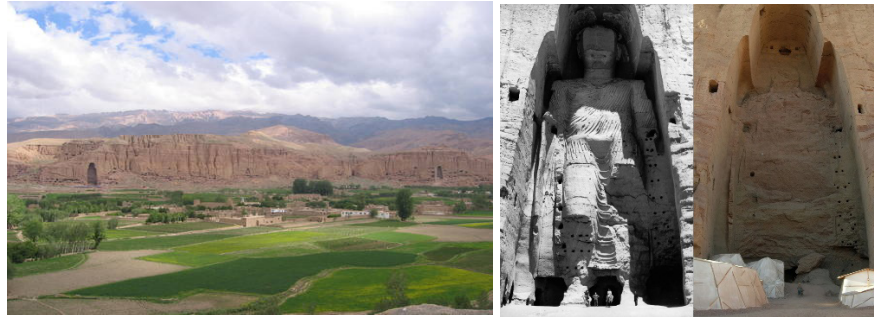
Şekil 5 Bamiyan Vadisi 46 ; Taliban tarafından yok edilen Buda heykeli (1963) ve yıkım sonrası durum 47 (2008).

Dinsel ya da mezhepsel ayrışmalar, devlet destekli ya da bireysel ikonoklazmın/vandalizmin tek nedeni değildir. Ulusal istikrara karşı tehdit olarak görülen dinsel alanlara saldırarak kültürel ya da kolektif belleği aşağılamak veya silmek insanlara kim olduklarını unutturacak kasıtlı eylemlerdir. Kosova Savaşı'ndan önce Kosova'daki Osmanlı Dönemi camileri gibi dini kültür varlıkları -bazı örnekler dışında- Sırp yasaları tarafından korunmamıştır. Savaştan sonra ise Kosova'daki Sırp yerlerinden edilmiş, evleri soyulmuş, eserleri vandalizme uğramıştır. Özellikle Kosova'daki Sırp dini mirası vandalizme uğramıştır. Özellikle Yugoslavya'nın dağılmasından sonra bile Milosevic döneminde Sırp Ortodoks Kilisesi'nin Sırp politikalarına hizmet ettiği düşünülmüş; Sırp'ların hiç